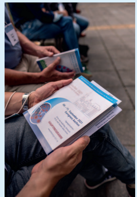
► Abb. 2 Programmauswahl.