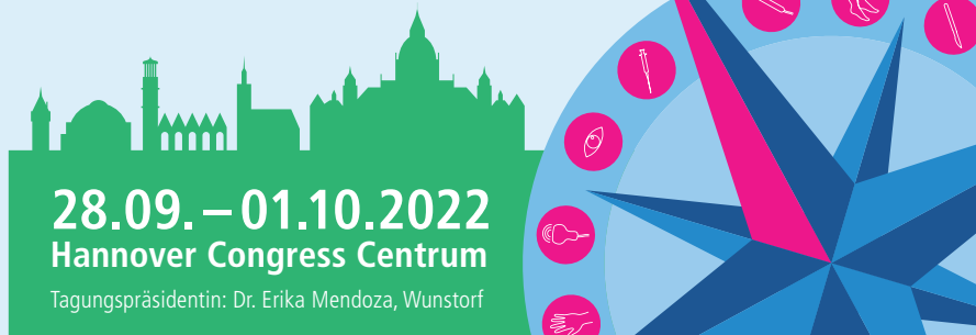
► Abb. 3 Choosing wisely – Kongressmotto in Hannover [rerif].

geräumt: so gab es wissenschaftliche Sitzungen zum Themenfeld Kompression, die Sklerosierungstherapie wurde behandelt und der große Raum der operativen und endoluminalen Therapie fand in zahlreichen Sitzungen Berücksichtigung. Venenerhaltende Therapiekonzepte bei der Stammvarikose und das tiefe Venensystem konnten erläutert werden, ebenso wie die Thrombotherapie. Im „Interessanten Fall“ wurden Situationen aus dem Praxis- und Klinikalltag geschildert und ausführlich diskutiert.