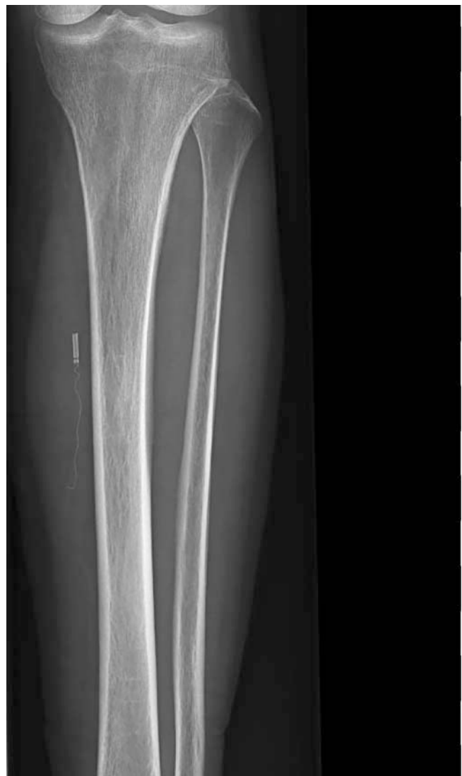
► Abb. 2 Röntgenaufnahme des linken Unterschenkels mit verbliebenen Katheteranteilen nach Venefit-Verfahren.