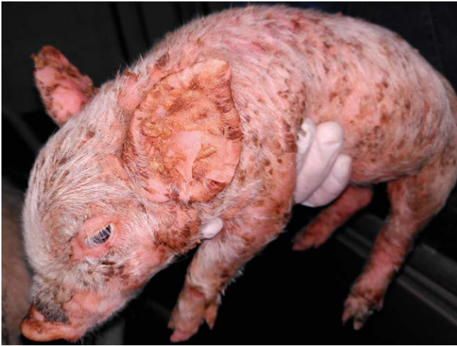
► Abb. 1 Saugferkel mit charakteristischen Läsionen.