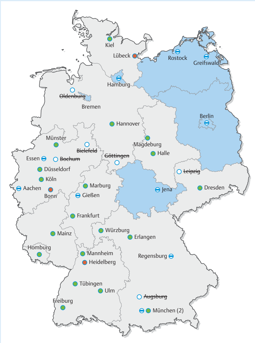
► Abb. 2 Übersicht der 38 deutschen Universitätsfrauenkliniken (UFK; Kreise) mit und ohne Angebot im Gebietschwerpunkt Gynäkologische Endokrinologie und Reproduktionsmedizin sowie entsprechende Lehrstühle: 19 UFK mit Gynäkologischer Endokrinologie und Reproduktionsmedizin (grün) ohne Lehrstuhl, 3 UFK mit Gynäkologischer Endokrinologie und Reproduktionsmedizin mit Lehrstuhl (rot), 10 UFK mit Gynäkologischer Endokrinologie ohne Lehrstuhl (blau/weiß), 6 UFK ohne Gynäkologische Endokrinologie oder Reproduktionsmedizin (weiß/durchgestrichen) und 6 Bundesländer ohne universitäres Angebot in der Reproduktionsmedizin (blau).

durch Ärzt*innen besetzt sind, weitere durch Wissenschaftler*innen. Die sehr positive Entwicklung der Anzahl an Lehrstühlen in dieser Säule der Frauenheilkunde wird u.a. durch den Ausbau der Hebammenwissenschaften auf akademischem Niveau auch zukünftig weiter voranschreiten.