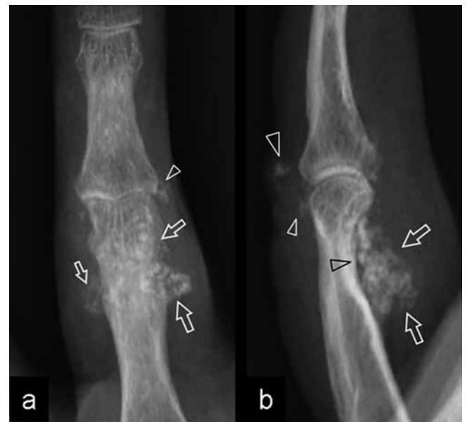
Fig. 1 a Anteroposterior and b lateral radiographs of the right ring finger. Soft-tissue calcified deposits (arrows) are visible on the volar aspect of the proximal phalanx associated with mild pressure erosion (black arrowhead) of the underlying bone. On the dorsal aspect of the joint, two small calcifications are also present.

Synovial chondromatosis is an unusual condition that most often involves synovial joints with or without extension into adjacent bursae. It is characterized by production of multiple cartilaginous nodules that derive from chondral metaplasia of the synovial membrane. This benign disorder clinically manifests with pain, swelling, intermittent joint locking and limitation of motion. Although any other synovial joint may theoretically be involved, synovial chondromatosis is rarely found in the fingers with only seven cases reported in the literature (Sheldon PJ et al. Radiographics 2005; 25: 105–219). In this case report, we describe the imaging findings of a patient with recurrent primary synovial osteochondromatosis of the proximal interphalangeal joint. To the best of our knowledge, this is the first case described in the literature, illustrated with ultrasound and a multimodality imaging study including plain films, ultrasound, CT, and MRI.