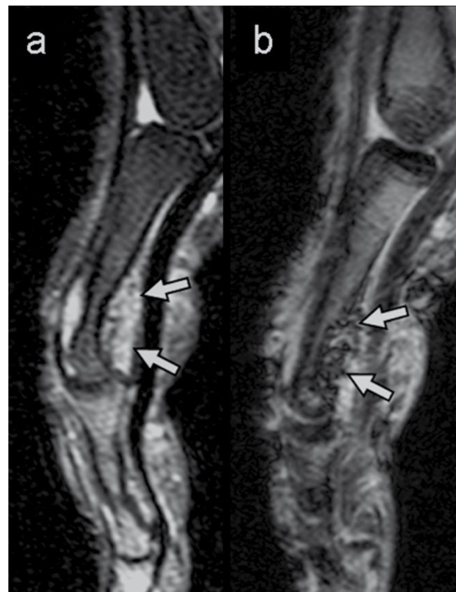
Fig. 3 Sagittal a T2-weighted tSE MR imaging over the proximal interphalangeal joint demonstrates the ventral joint recess (arrows) filled with high-signal material with some small hypointense dots. b GRE T2* pulse sequence reveals a more definite punctuate pattern within the recess owing to the presence of calcified loose bodies.

Synoviale Chondromatose der Hand ist selten. Nur 7 Fälle, in denen die interphalangealen Gelenke betroffen waren, wurden in der englischen Literatur veröffentlicht (Kumar A., et al. Hand Surg 2000; 5: 181–183). In unserer Patientin zeigten gewöhnliche Röntgenbilder eine Ansammlung von kleinen, strahlendichten Fragmenten um das proximale intraphalangeale Gelenk. Im CT