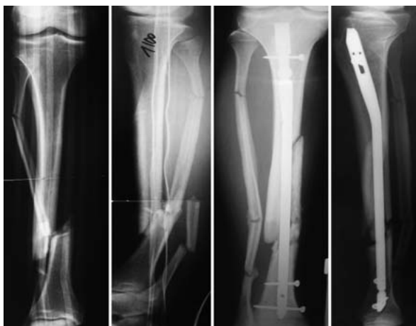
Abb. 1 1/2000: Unterschenkelfraktur mit Tibiafraktur am Übergang vom mittleren zum distalen Drittel, auf dem postoperativen Bild erkennt man, dass es zu einer Sprengung des mittleren Drittels gekommen ist.