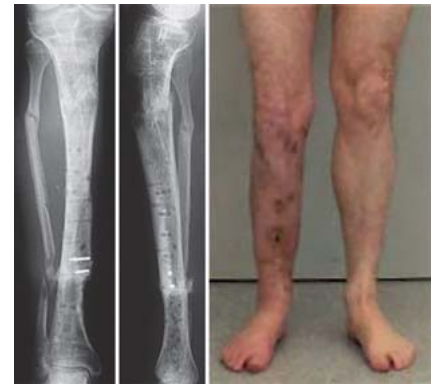
Abb. 8 9/2007: Ausheilung 7 1/2 Jahre nach Unterschenkelfraktur.