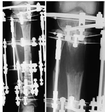
Abb. 7 1/2006: Resektion der Pseudarthrose und Callusdistraction.