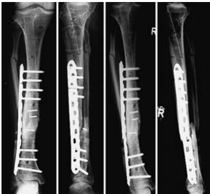
Abb. 6 9/2005: Erneute Plattenosteosynthese. 1/2006: Erneuter Plattenbruch.