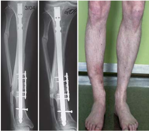
Abb. 4 3/2004: Rettungsversuch mit einer winkelstabilen Platte und Spongiosaplastik. 6/2004: Schraubenbruch und zunehmende Varusfehlstellung.