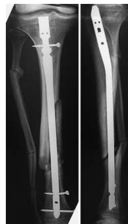
Abb. 3 9/2000: Durch etwas andere Projektion ist erstmals klar, dass der Nagel im mittleren Drittel dorsal „im Freien“ steht“, wegen mäßiger Beschwerden wird abgewartet.