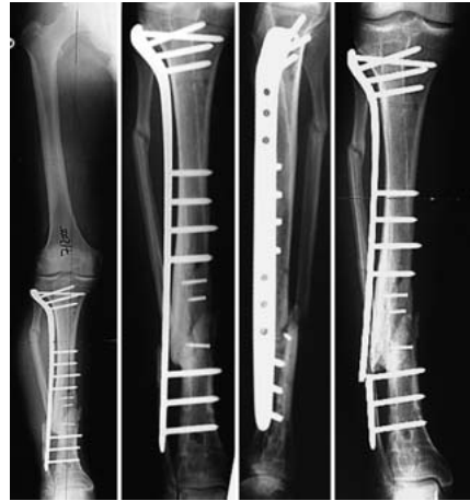
Abb. 5 7/2005: Achsenkorrektur im Bereich der Pseudarthrose und Stabilisierung mit winkelstabiler Platte. 9/2005: Plattenbruch.