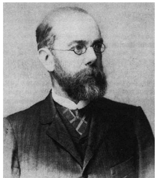
Abb. 1 Robert Koch (ca. 1884).

Die Bakteriologie gab ansteckenden Krankheiten ein neues Gesicht in der Gestalt kleiner, unsichtbarer Erreger und versprach zugleich, die Welt von diesen Krankheiten befreien zu können. Infektionskrankheiten erkannte man als von Bakterien verursacht und die Bakteriologen waren die Männer, die dieser Gefahr zu begegnen wussten. Im Falle keiner Krankheit gilt dies mehr als in dem der Tuberkulose. Die zumeist als Schwindsucht bekannte Krankheit war wahrscheinlich die wichtigste Todesursache im Europa des 19. Jahrhunderts für annähernd 15% aller Todesfälle verantwortlich zu machen. Gleichzeitig veränderte sich in diesem Zeitraum ihr Begriff dramatisch: Zu Beginn des 19. Jahrhunderts gab es eine nach ihrem typischen Verlauf als Schwindsucht bekannte Lungenerkrankung mit dem wissenschaftlichen Namen Phthisis, deren Verwandtschaft mit einer Reihe von anderen Krankheiten vermutet wurde. Am Ende des Jahrhunderts waren alle diese Krankheiten, deren Namen wie Lupus, Skrofeln etc. heute nur noch dem Fachmann bekannt sind, zu klinischen Erscheinungsbildern ein und derselben Infektionskrankheit geworden, eben der Tuberkulose 1 .