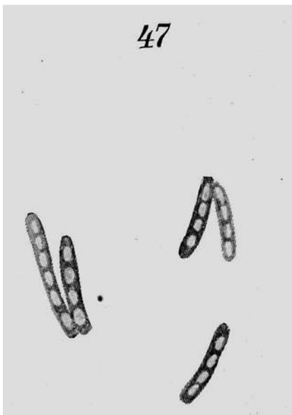
Abb. 3 Kochs Zeichnung der Sporen des Tuberkelbazillus von 1884. Quelle: [15].

Paul Baumgarten (1848 – 1928) hatte nicht nur fast zeitgleich mit Koch ebenfalls Tuberkelbazillen gesehen, er hatte auch auf ein Färbeverfahren verzichtet, d.h. identische Formen unter dem Mikroskop beobachtet und deren Zusammenhang mit den pathologisch-anatomischen Veränderungen beschrieben. 15 Wie aus den wenigen Notizen, die von Kochs Arbeiten überliefert sind, hervorgeht, waren seine Untersuchungen im März 1882 noch in vollem Gange und eine ganze Reihe der Experimente, die in der ausführlichen Darstellung des Jahres 1884 beschrieben sind, wurden erst nach dem März 1882 durchgeführt. Koch war also in Eile und hatte allen Grund dazu.