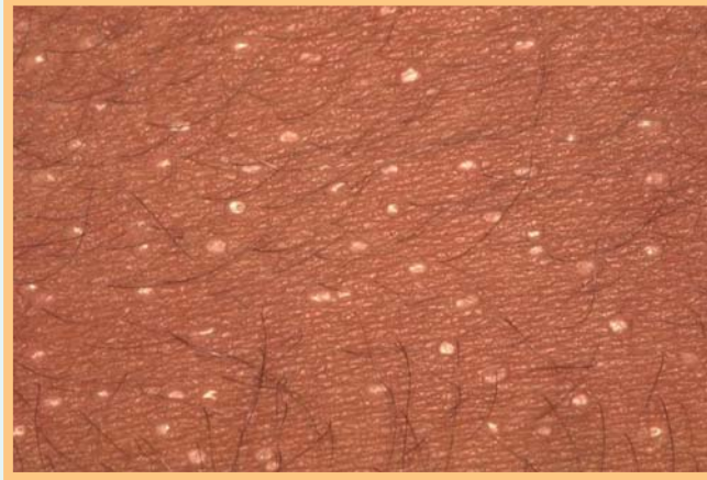
Abb. 1 Kleine Papeln am Abdomen.