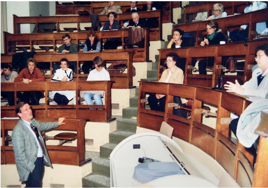
Abb. 2 Vorlesung im alten Hörsaal des Zentrums für Innere Medizin.