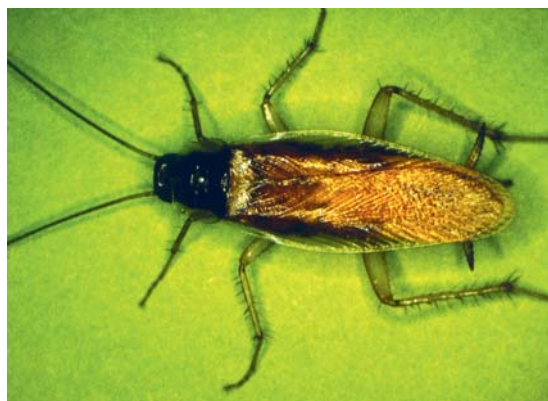
Abb. 15 Blattella germanica , sog. Deutsche Schabe.

von Schaben (sog. Waldschaben), die aber nur selten in Häuser vordringen. Neben Blattella germanica (Abb. 15) treten noch 3 weitere, vor Jahrhunderten importierte Schabenarten auf, richten aber faktisch gleiche Schäden an (Tab. 2).