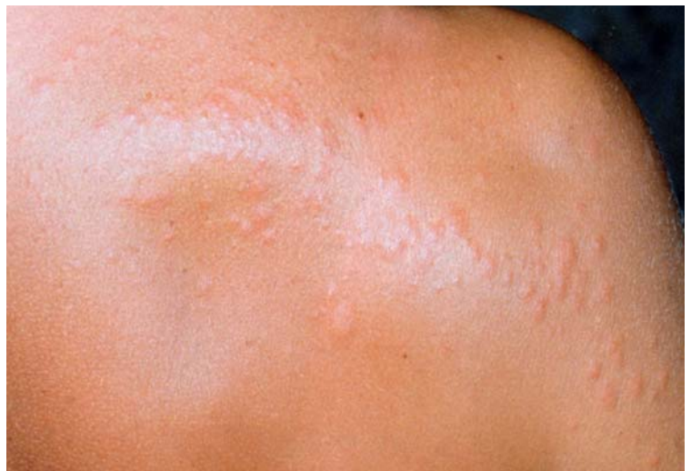
Abb. 14 Wanzenstiche auf dem Rücken einer Frau.

Die sog. Deutsche Schabe ( Blattella germanica ) ist die in Deutschland am häufigsten angetroffene Schabe in Häusern. Im Freien gibt es allerdings noch eine Reihe