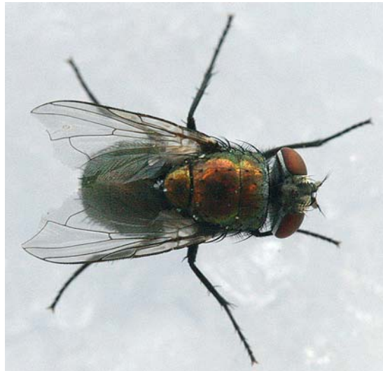
Abb. 17 Lucilia sericata ; adulte Fliege.