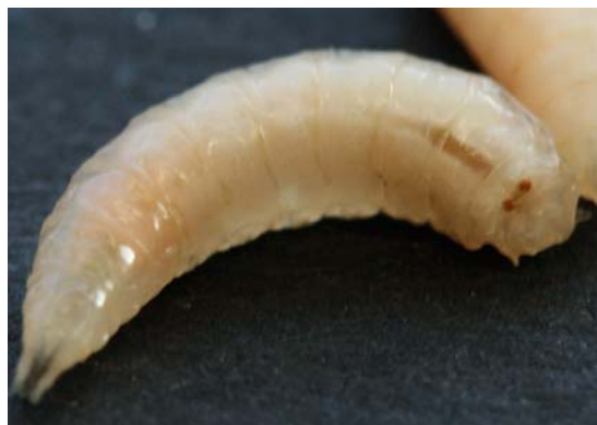
Abb. 18 Lucilia -Larve.