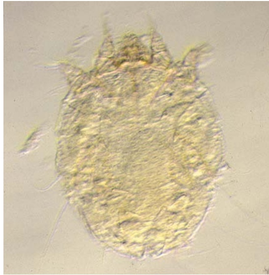
Abb. 1 Lichtmikroskopische Aufnahme (LM) einer adulten Krätzmilbe.