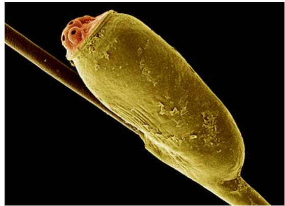
Abb. 9 REM-Foto eines Eies (Nisse) der Kopflaus an einem Haar.

Die Übertragung von Läusen erfolgt prinzipiell bei Körperkontakt; bei Kleiderläusen kommt noch der Tausch der Kleidung hinzu, weil sich die Eier und auch die Entwicklungsstadien oft an deren Innenseite aufhalten. Wegen des etwa 3-wöchigen Entwicklungszyklus wird ein Befall oft erst spät bemerkt, und die „Quelle“ ist dann häufig nicht mehr feststellbar. Kopfläuse werden faktisch nur bei Haarkontakten übertragen.