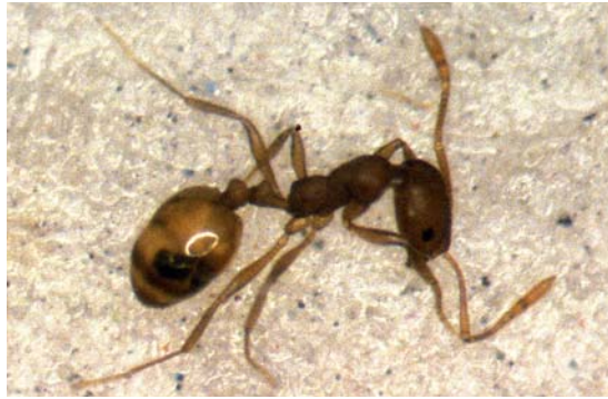
Abb. 16 Pharaon-Ameise: lichtmikroskopische Seitenansicht.

Lucilia-Larven oder Extrakte daraus eignen sich zum Debridement schlecht heilender Wunden.