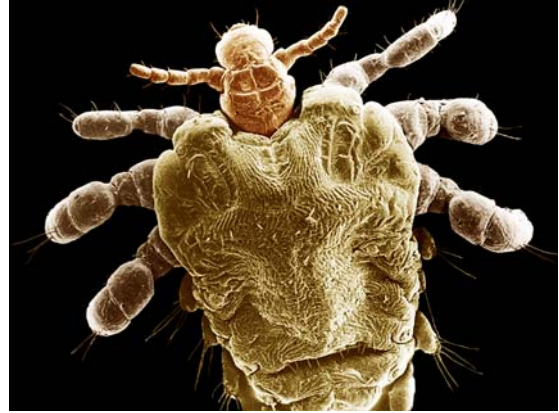
Abb. 8 REM-Aufnahme einer Filzlaus.

Alle Läuse saugen beim Menschen Blut – im Regelfall alle 2–3 Stunden. Je nach aufgenommenen Menge des Blutes bzw. dem Grad des Abbaus im Darm erscheinen die Läuse unterschiedlich gefärbt von gelblich-rötlich bis fast schwarz. Die Überlebenszeit ohne wärmenden und nährenden Wirt ist nur bei Kleiderläusen beachtlich (Tab. 1), wo mehrere Tage – insbesondere bei niedrigen Temperaturen erreicht werden. So können Kleiderläuse auch in unbewohnten Räumen für mehrere Tage auf neue Wirte lauern.