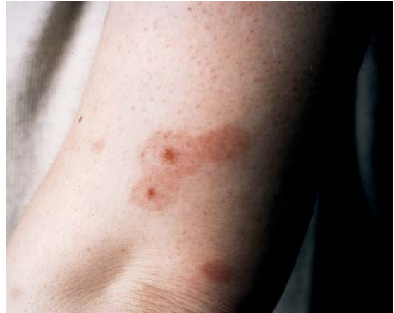
Abb. 12 Flohstiche in Reihe.

Adulte Flöhe können durch Versprühen von Insektiziden in leeren (!) Zimmern vernichtet werden (die Matratzen müssen auch von unten besprüht werden). Da die Larven nicht vom Insektizid abgetötet werden, müssen zusätzlich auf dem Boden unter dem Bett bzw. im Bettkasten sog. Umgebungssprays ausgebracht werden, die die Häutung der Larven unterbinden und auch nicht toxisch beim Menschen wirken. Ihre Wirkung hält für Wochen bis Monate an.