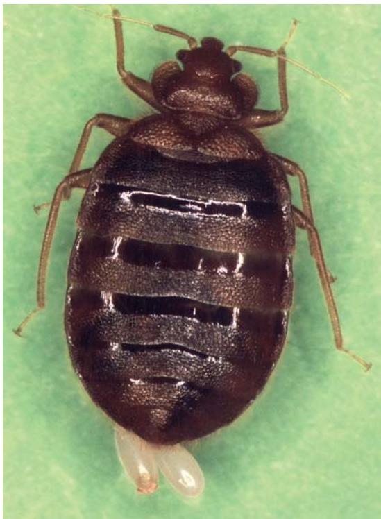
Abb. 13 LM-Aufnahme einer Bettwanze mit 2 Eiern.

Die Bekämpfung in verwanzten Räumen kann erfolgreich nur durch den erfahrenen Schädlingsbekämpfer durchgeführt werden. Es wirken zwar die vorhandenen Insektizide, allerdings müssen die Verstecke erreicht werden. Auch muss eine Entwesung mindestens 2mal im Abstand von 8–10 Tagen durchgeführt werden.