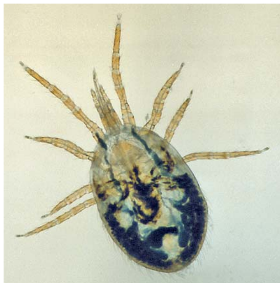
Abb. 5 Lichtmikroskopische Aufnahme einer Vogelmilbe ( Dermanyssus gallinae ).