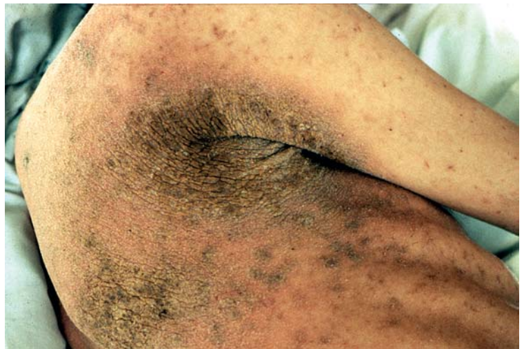
Abb. 4 Patient mit Borkenkrätze ( Scabies crustosa ).

Alle Stadien der Läuse sind durch je 6 kräftige Klammerbeine ausgezeichnet, mit denen sie sich an Körperhaaren so fest verankern, dass sie selbst mit Spezialkämmen nur schwer zu entfernen sind. Alle befestigen ihre Eier (Nissen) mit einer wasserunlöslichen Substanz an Körperhaare, wobei die Kleiderlaus (sogar bevorzugt) ihre Eier auch noch an Fasern der Kleidung festheftet. Diese Eier können anhand ihrer Deckelform (mit artspezifischen Öffnungen = Aeropylen) identifiziert werden (Abb. 9).