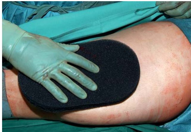
Abb. 2 Anpassen des Schwammes an die Wundform (schwarzer PU-Schwamm).