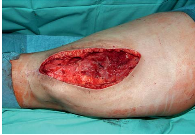
Abb. 1 Infizierte Wunde des Oberschenkels rechts nach Abszessspaltung, Débridement und Spülung der Wunde.

Frühere Studien ergaben widersprüchliche Angaben bezüglich der bakteriellen Belastung von Wunden unter Vakuumtherapie. Eine signifikante Abnahme der Bakterienzahl wurde in Gewebeproben bei Schweinen unter dieser Therapie verzeichnet, wie auch einige klinische Studien eine Abnahme der Bakterienlast beschreiben [2, 8, 14, 22]. Im Gegensatz zu diesen Beobachtungen konnten Moues et al. keinen Unterschied der Biolast zwischen vakuum- und gazebehandelten Wunden feststellen [16]. Weed beobachtete sogar einen Anstieg der Bakterienlast während der V.A.C.-Therapie [22].