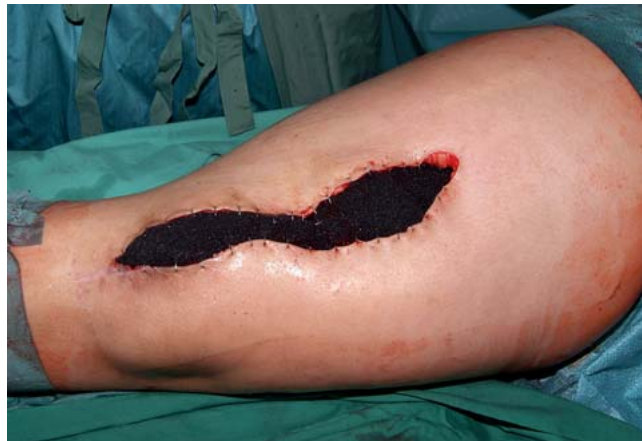
Abb. 3 Fixierung des Schwammes an den seitlichen Wundrändern mit Hautklammern (in anderen Fällen kann dies auch mittels Hautnaht oder ohne jegliche Fixierung erfolgen).