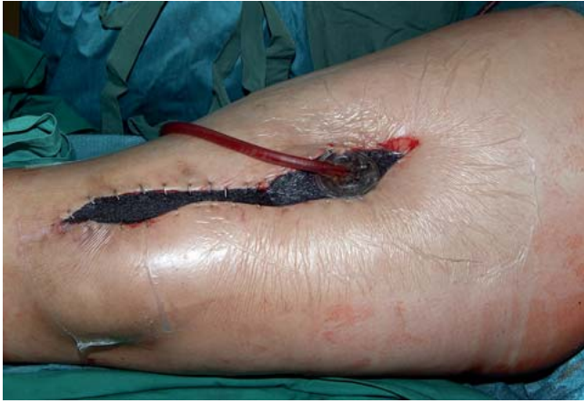
Abb. 7 Nach Anschluss des Vakuums mit 125 mmHg. Im Vergleich zum Ausgangsbefund ( Abb. 6 ) zeigt sich durch das sogbedingte „Schrumpfen“ des Schwammes eine deutliche Verschmälerung der Wunde.