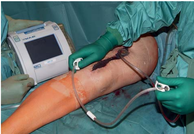
Abb. 8 Aufgrund der kompakten Vakuumquelle kann der Patient frühzeitig mobilisiert werden.

oberfläche, sodass dieser an der gesamten Wundfläche anliegen kann. Falls ein direkter Kontakt mit der Wundfläche, insbesondere in der Tiefe, nicht erreicht wird, ist eine „Totraumversiegelung“ und die Entwicklung einer Abszessbildung möglich.