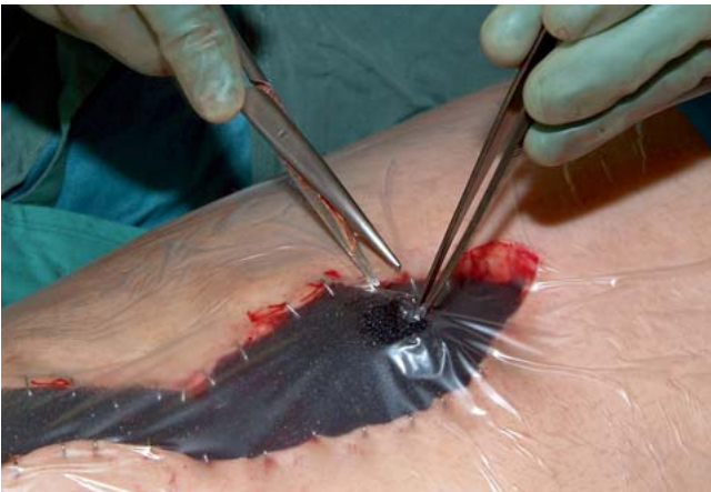
Abb. 5 Einschneiden eines kleinen Loches in die Folie.