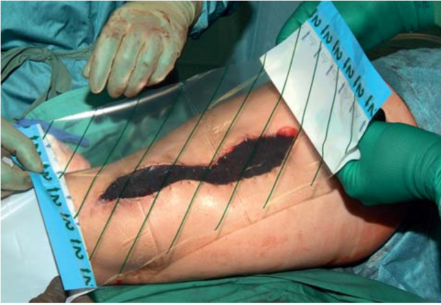
Abb. 4 Versiegelung der Wunde mittels luftdichter transparenter Klebefolie.