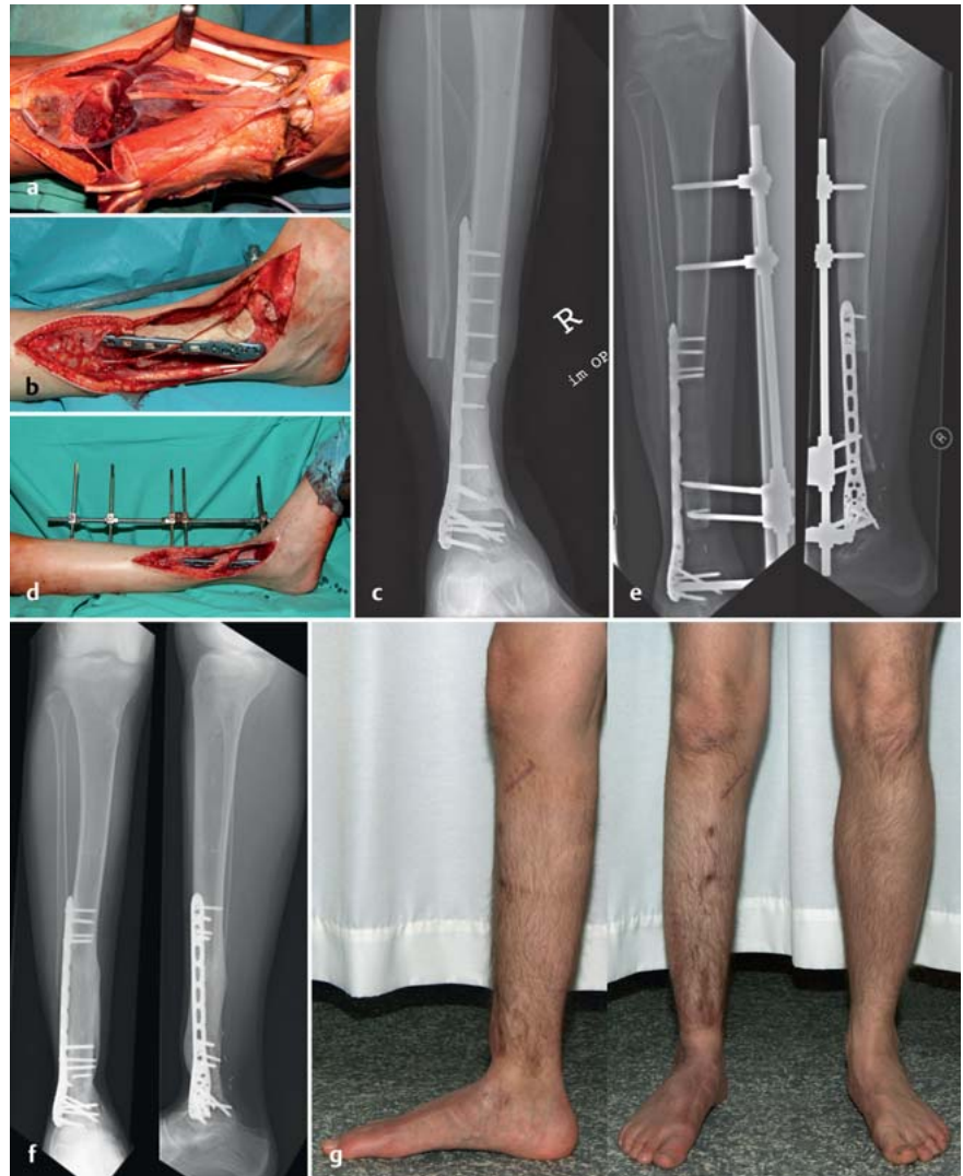
Abb. 4a bis g a En-bloc-Resektion der distalen Tibia und Fibula mit Resektion des anterioren Kompartiments und des M. flexor hallucis longus a.G. eines Osteosarkoms. b, c Implantation eines PMMA-Spacers über 10 cm als distaler Tibiaersatz und tibiotalare Stabilisation mittels winkelstabiler Platte. d Segmenttransport in Monorail-Technik mittels Regazzoni-Fixateur nach Explantation des PMMA-Spacers 10 Monate nach Tumorresektion und Abschluss der systemischen Chemotherapie. e Verlaufskontrolle des Segmenttransports mittels konventionellem Röntgenbild 60 Tage nach Transportbeginn. Klare Darstellung der Kalzifizierung des Regeneratknochens. f Der integrierte Regeneratknochen ist komplett tibiotalar integriert und füllt den ehemaligen Defekt komplett aus. g Vollbelastung 3 Monate nach Docking-OP und insgesamt 8 Monate nach Transportbeginn.

Die gefäßgestielte Fibula ist das am häufigsten verwendete Transplantat in der Tumorchirurgie. Im Bereich der Tibia kann die ipsilaterale Fibula in den Defekt hineingeschwenkt werden und so eine mikrochirurgische Gefäßanastomose vermieden werden. Die Stabilität der unteren Extremität ist bei Transplantation eines Fibulatransplantats erst nach Hypertrophie der Fibula gegeben. Dies kann je nach Alter des Patienten auch bis zu 24–36 Monate in Anspruch nehmen mit entsprechender Gefahr von Frakturen des Transplantats und/oder des Osteosynthesematerials. Junge Patienten zeigen ein deutlich schnelleres Hypertrophiepotenzial. Im Bereich der oberen Extremität ist ein Transplantat für die Stabilität in der Regel ausreichend. Um die Stabilität im Bereich der unteren Extremität zu erhöhen, besteht die Möglichkeit eines sog. Manteltransplantats. Hier wird um die eingebrachte Fibula ein kortikaler Allograft eingebracht. Die Erfahrungsberichte in der Literatur sind jedoch auf kleine Fallserien beschränkt. Alternativ kann eine 2. kontralaterale Fibula transplantiert werden. Die gefäßgestielte Fibula ist operationstechnisch anspruchsvoll und zeitaufwendig. Nachteilig bei bi-