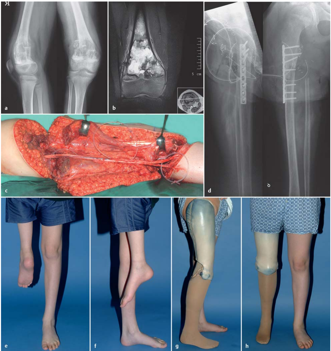
Abb. 5 a bis h a Darstellung des Osteosarkoms am distalen Femur rechts im konventionellen Röntgen. b Darstellung des Osteosarkoms am distalen Femur rechts im MRT. c Langstreckige Darstellung der A. femoralis/poplitea und des N. ischiadicus. d Postoperatives Röntgenbild: Nach Drehung des Unterschenkels um 180° wurde die proximale Tibia an das proximale Femur mittels Plattenosteosynthese augmentiert. e, f Die Gelenkebene des oberen Sprunggelenks wurde exakt auf Höhe der kontralateralen Kniegelenkebene eingestellt. g, h Die individuell angepasste Prothese ermöglicht eine gute Funktion für Gang und Stand.

sie) bietet der allogene Knochen sogar Vorteile gegenüber dem Autograft. Bei Kindern zeigt der spongiöse Allograft eine recht gute Integration und umgeht das Problem der Spongiosaentnahme am wachsenden Skelett. Der kortikale Allograft zielt auf eine Wiederherstellung der ursprünglichen Anatomie hin.