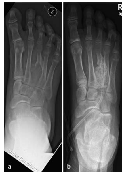
Abb. 1 a und b a Aneurysmatische Knochenzyste am Os metatarsale III. b Defektauffüllung durch Transplantation von autologer Spongiosa am Os metatarsale III.

Prinzipiell kommen biologische und prothetische Lösungen zum Einsatz. Die biologische Knochenrekonstruktion zeichnet sich durch zahlreiche Vorteile aus, wie Langlebigkeit durch Anpassung an Veränderungen der mechanischen Belastung und der Fähigkeit des Längenwachstums beim Kind und Jugendlichen. Die operativen Eingriffe sind häufig technisch anspruchsvoll und bleiben dem Erfahrenen vorbehalten. In der Regel sind strenge Nachbehandlungsregime wie passagere Teilbelastung, temporäre Karenz von Sport, Physiotherapie und eine enge Nachsorge notwendig. Prothetischer Knochenersatz hingegen verfügt über eine hohe Primärstabilität, die operativen Eingriffe sind standardisierter und dank moderner modularer Prothesensysteme gerade beim Erwachsenen individuell anzupassen. Bekannte Nachteile von Prothesen können Implantatversagen wie Lockerungen oder Bruch, allergische Reaktionen oder implantatassoziierte Infekte sein.