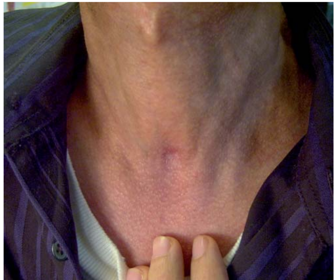
Abb. 3 Kosmetisches Ergebnis nach perkutaner Dilatationstracheotomie bei einem 30-jährigen Patienten (Langzeitbeatmung aufgrund einer Pneumonie nach Stammzelltransplantation).

Weitere absolute Kontraindikationen umfassen erschwerte oder unmögliche Intubationsverhältnisse, eine instabile Halswirbelsäulenfraktur sowie den respiratorischen Notfall. Beim letzteren ist die sofortige endotracheale Intubation, supraglottische Atemwegssicherung oder Koniotomie durchzuführen. Da es bei Kindern aufgrund einer erhöhten Elastizität der Trachea zu Verletzungen der Trachealhinterwand kommen kann, wird in der Regel auch ein jugendliches Alter als Kontraindikation für die Durchführung einer perkutanen Dilatationstracheotomie angesehen.