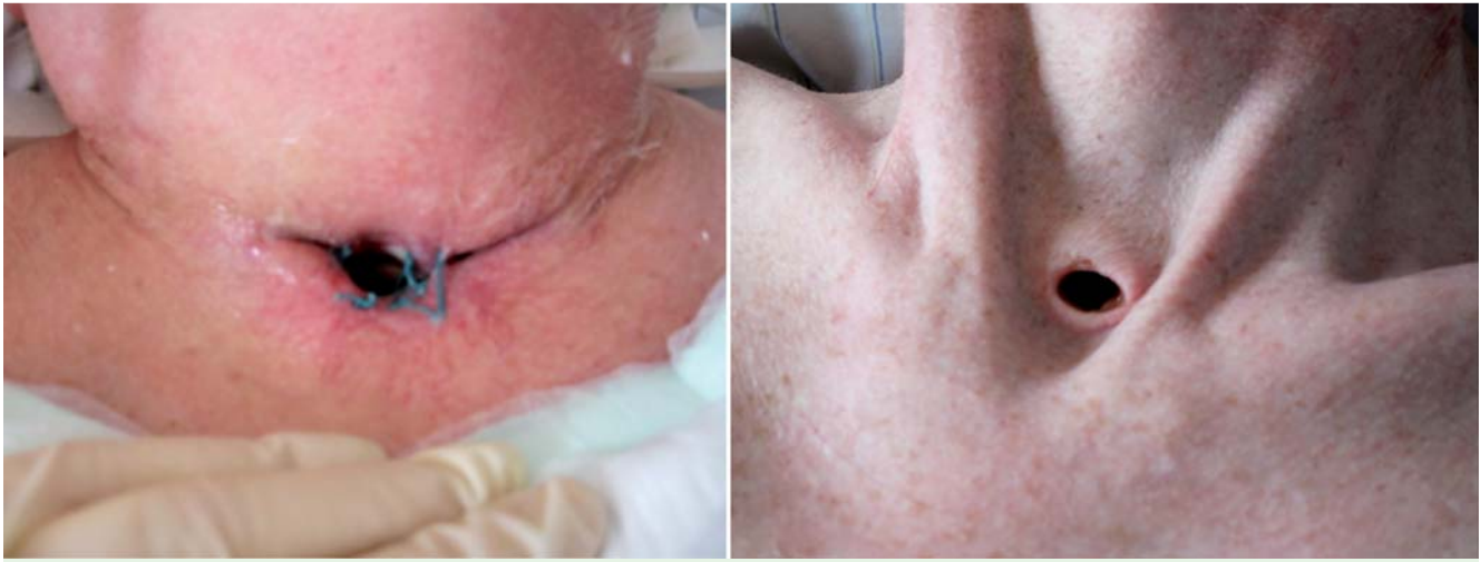
Abb. 1 Vergleich der Techniken. links konventionelles („chirurgisches“) Stoma; rechts dilatatives Stoma.

beim kardiogenen Lungenödem, bei einem Teil der Patienten auf eine Intubation und invasive Beatmung verzichtet werden. Trotzdem ist es in den letzten Jahren zu einer deutlichen Zunahme von Tracheotomien auf den Intensivstationen gekommen [3]. Gründe dafür sind zum einen die generellen Fortschritte in der intensivmedizinischen Behandlung Schwerstkranker mit einer damit einhergehenden zunehmenden Anzahl von langzeitbeatmeten Patienten, zum anderen zeigen Studien der letzten Jahre, dass bei bestimmten Patientenkollektiven eine frühzeitige Tracheotomie die Zeitdauer der Beatmung und den Intensivaufenthalt verkürzt [4].