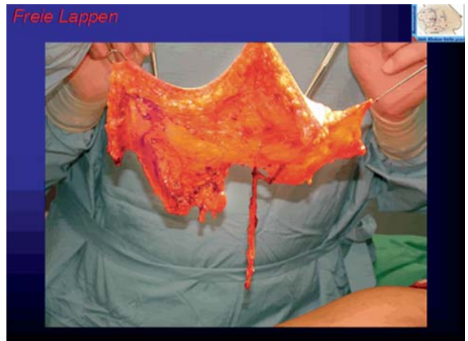
Abb. 2 Bipedikulärer DIEP-Flap.

oder beidseitige sekundäre Wiederherstellung mittels Eigengewebe inzwischen Standard.