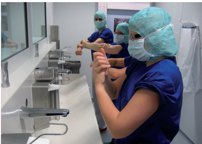
Nach jeder theoretischen Anleitung folgen für die OTA-Auszubildenden praktische Übungen, z. B. die korrekte chirurgische Händedesinfektion.

Das Team des Tübinger Experimental-OPs hat dafür einen Standard mit einem genauen Bewertungssystem entwickelt. Personen aus verschiedenen medizinischen Berufen benutzen als Produkttester in simulierten OPs ein Gerät. Dazu bekommen sie von OP-Fachpflegerin Hagen standardisierte Aufgaben gestellt. Beispielsweise müssen sie mit einem zu erprobenden OP-Mikroskop ein Bild schießen oder eine bestimmte Funktion am Gerät aktivieren.