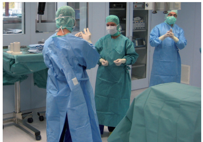
Wer den „OP-Führerschein“ bestehen möchte, muss lernen, wie man sich im OP verhält. Dazu gehört auch die knifflige Aufgabe, sterile Handschuhe richtig anzuziehen.