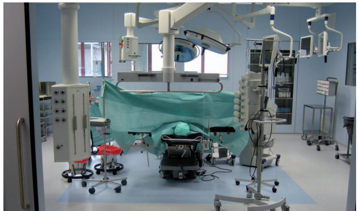
Der große OP-Saal ist vorbereitet: der „Patient“ (eine Attrappe) liegt gelagert für die nächste Operation bereit. Der OP ist voll-funktionsfähig und modern eingerichtet.

Das Herzstück der 1000 Quadratmeter messenden Anlage sind ein großer und ein kleiner OP-Saal, ein Einleitungs- sowie Aufwachraum und ein Krankenzimmer, das zum Beispiel als Intensivzimmer umgebaut werden kann. Außerdem gibt es viel Raum für theoretisches Training, Vorträge und Seminare. Die OP-Säle sind komplett und modern eingerichtet, am Boden liegt kein Kabel, fast alle Geräte sind an der Decke montiert. Hier finden niemals Operationen an Mensch oder Tier statt, sondern ausschließlich an Attrappen. So können Maschinen und Instrumente unter realen Bedingungen getestet oder Schulungen durchgeführt werden, ohne dass jemandem geschadet wird. An den Wänden sind Videokameras und Mikrofone angebracht, die jeden Test zur späteren Auswertung mitschneiden. Zudem gibt es einen kleinen Raum, von dem aus man das Geschehen im großen OP durch eine Glas-