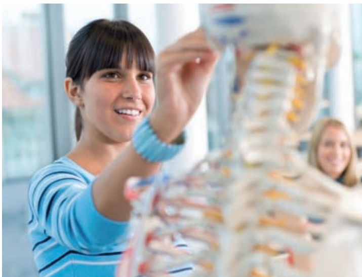
Grafik: BITmap, Mannheim