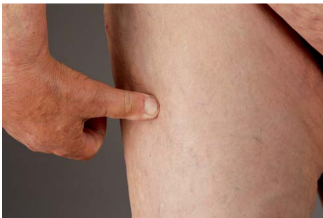
Abb. 1 Symmetrische, brettharte Sklerose an den Beinen mit Ausbreitung bis zur Hüfte.