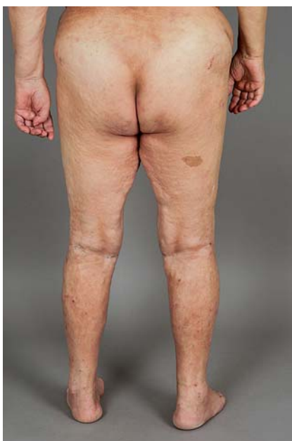
Abb. 2 Deutliches Orangenhaut-Phänomen der betroffenen Regionen.