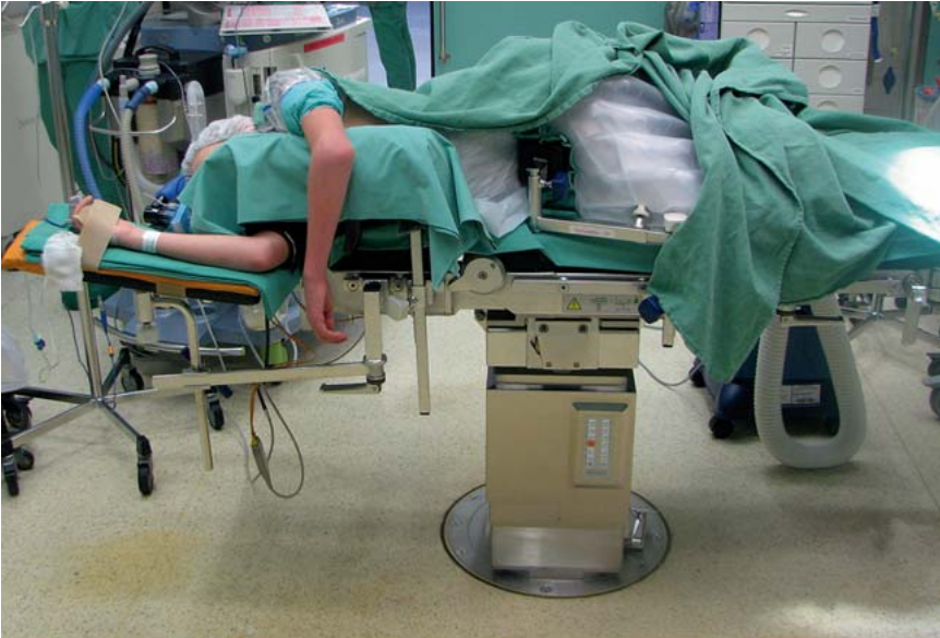
Abb. 1 Die Seitenlagerung bietet eine freie Lagerung des Ellenbogens und gute Zugangsmöglichkeiten für den Operateur und die Anästhesie.

applikation über Katheter, jedoch keine Möglichkeit einer sofortigen postoperativen Nervenbeurteilung. Eine Kombination von Allgemeinanästhesie mit postoperativer Kontrolle der Neurologie und anschließender regionalen Analgesie ist eine weitere Möglichkeit [4,5].