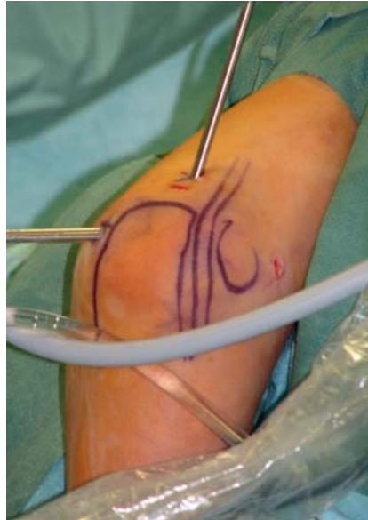
Abb. 5 Arthroskop im posterolateralen Portal und Shaver im posterozentralen transtendinösen Portal.

Lindenfeld platziert den anteromedialen Zugang weiter proximal und weiter dorsal (1 cm proximal und 1 cm vor dem Epicondylus medialis, ähnlich wie Poehling et al., die das Portal 2 cm proximal des Epicondylus medialis unmittelbar vor dem Septum intermusculare platzieren) [9,17]. Dadurch vergrößert sich der Abstand zum N. medianus auf 22,3 mm, wenn der Zugang nicht rechtwinklig zu den neurovaskulären Strukturen, sondern schräg nach distal in Richtung Ellenbogenzentrum angelegt wird. Der Zugang verläuft durch den M. flexor carpi radialis und den M. flexor digitorum su-