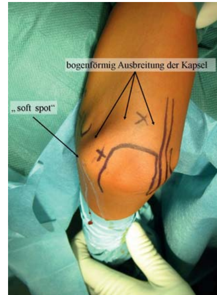
Abb. 2 a und b Die Landmarken zur Orientierung werden angezeichnet. a Epicondylus lateralis, Olekranon, Radiusköpfchen sowie das proximale, mittlere und distale anterolaterale Portal. b Markierung des Olekranons, des Epicondylus medialis und des Verlaufs des N. ulnaris sowie des posterolateralen, posterozentralen und des anteromedialen Portals.