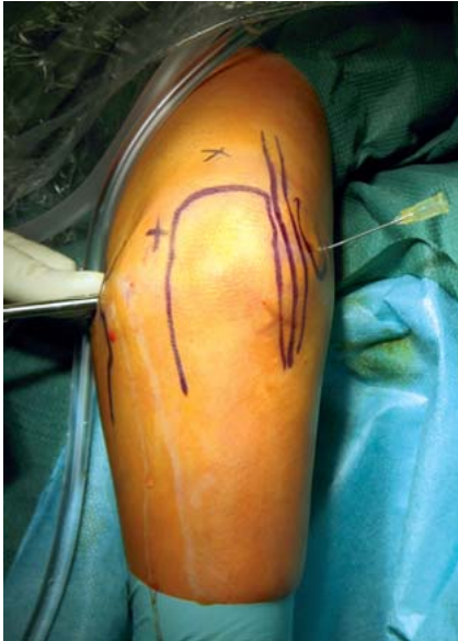
Abb. 4 Das anteromediale Portal wird durch eine Kanülenpunktion unter arthroskopischer Sicht von anterolateral angelegt („outside-in“-Technik).

cherheit gibt [15,17,19]. Des Weiteren wird die gute Einsehbarkeit in das vordere Kompartiment beschrieben [10].