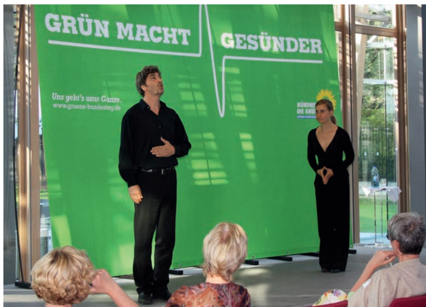
Das frei.wild Improvisationstheater Berlin ließ am Ende der Veranstaltung humorvoll und gestenreich den Tag Revue passieren.