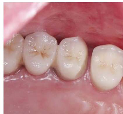
Komplikation: Vollkeramikbrücke mit typischen Keramikabplatzungen nach einer Tragedauer von 4 Monaten.