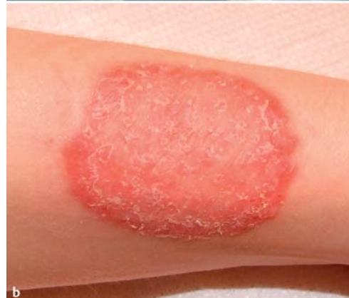
Abb.4 a Trichophyton interdigitale : Der zoophile Stamm wurde von einem 4-jährigen Jungen mit Tinea faciei isoliert, Infektionsquelle war ein Meerschweinchen. Morphologisch ist an die früher in der alten Nomenklatur bekannte Subspezies Trichophyton mentagrophytes variatio asteroides zu denken, welche heute jedoch Trichophyton interdigitale entspricht. b Tinea manus durch einen zoophilen Stamm von Trichophyton interdigitale bei einer 26-jährigen Frau. Potenzielle Infektionsquellen waren als Haustiere gehaltene Meerschweinchen, Mäuse oder Zwergkaninchen.