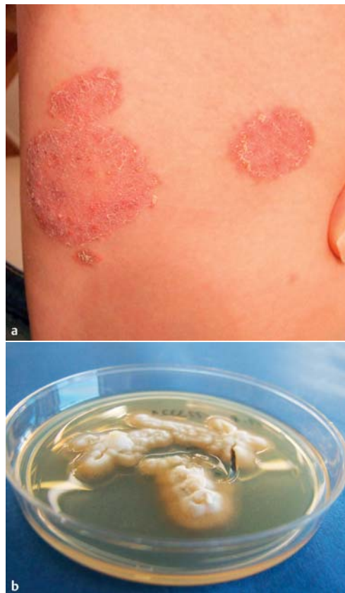
Abb. 7 a Tinea corporis durch Trichophyton verrucosum bei einer 17-jährigen Patientin, die im Rinderstall beschäftigt war. Die Plaques sind infiltriert und pustulös im Sinne einer stark entzündlichen Tinea profunda . b Trichophyton verrucosum : Isolat von der 17-jährigen Patientin (☉ Abb. 7 a ). Der langsam wachsende zoophile Dermatophyt zeigte einen typischen verrukösen, weiß-grauen Thallus.

parat (KOH oder Blancophor®) ebenfalls aus vier Lokalisationen der Pilzinfektion. Das dritte Kriterium, der kulturelle Nachweis von T. rubrum aus mindestens drei der vier Lokalisationen der Tinea , ergibt sich selbstverständlich.