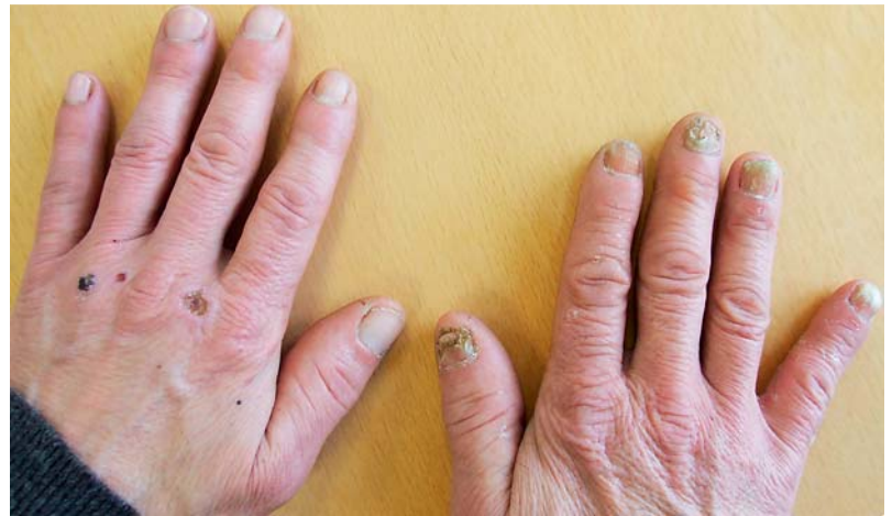
Abb.3 Two-feet-one-hand-syndroms mit Trichophyton rubrum -Infektion der Fingernägel der rechten Hand bei einem 77-jährigen Patienten.