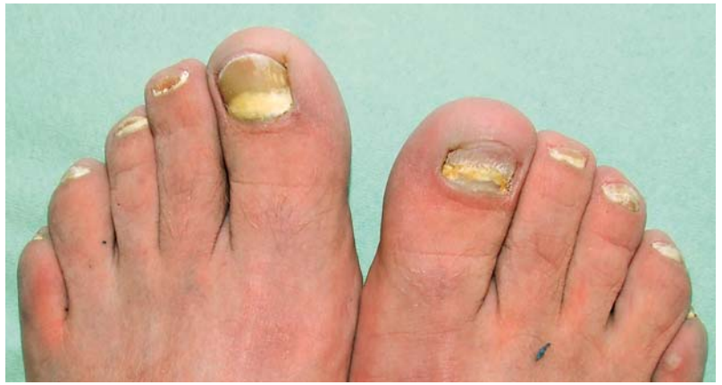
Abb. 11 Proximal weiße subunguale Onychomykose durch Trichophyton rubrum bei einem 41-jährigen HIV-positiven Mann mit manifester AIDS-Infektion.

Die Maximalvariante ist die total dystrophische Onychomykose (TDO). Früher gab es den von H. Grimmer geprägten Begriff des Gletscher-Nagels.