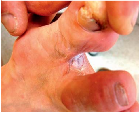
Abb. 2 Hyperkeratotische und interdigitale Tinea pedis durch Epidermophyton floccosum bei einem 29-jährigen Mann.

Abb. 1 Tinea pedis interdigitalis durch Trichophyton rubrum bei einem 59-jährigen Patienten mit hyperkeratotischen, trockenen, schuppigen und mazerierten Zehenzwischenräumen.