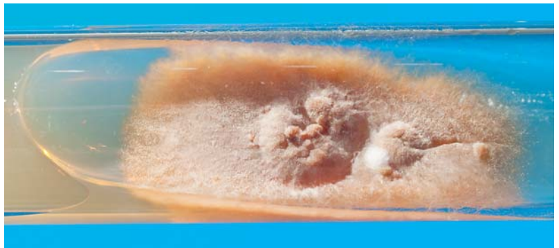
Abb. 12 Epidermophyton floccosum: Auf Sabouraud-Glucose-Agar erscheint ein olivgrüner, samtartiger Thallus des anthropophilen Dermatophyten. Isolat aus Hautschuppen bei Tinea pedis.

Grimmer hielt am 15.1.1961 in Essen zur Gründungsversammlung der Deutschsprachigen Mykologischen Gesellschaft den Vortrag „Histologische Untersuchungen bei Nagelmykosen (Nachweis vegetativer Pilzelemente und deren Bedeutung für die Griseofulvin-Therapie)“. Er schrieb damals, von Ausnahmen abgesehen, „stellt die Lokalisation einer Pilzkrankung durch Hyphomyzeten primär eine subunguale Mykose und keine Onychomykose im eigentlichen anatomischen Sinne dar...Die Reaktion des Epithels des Nagelbettes auf die pathogene Wirkung des Hyphomyzeten ist eine evtl. recht erhebliche Akanthose sowie wechselnde starke Hyperkeratose, die sich klinisch in einer Anhebung der Nagelplatte äußert.“ Die gesunde, nachwachsende Nagelplatte schiebt sich „nach Art eines Gletschers über das hyperkeratotische Nagelbett hinweg“ [42]. Heute kennt man die sog. subungualen Dermatophytome, d.h. Zusammenballungen von Pilzelementen, vorzugsweise Arthrosporen, aber auch Pilzhyphen und Keratinmassen unterhalb der gelblich-braun verfärbten Nagelplatte [43]. Eine für diese OM charakteristische Ausprägungsform sind die „gelben Streifen“, die als Längsstreifen medial oder lateral oft die Nagelmatrix erreichen.