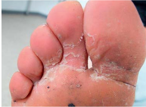
Tab. 1 Symptome der Tinea pedis im Zehenzwischenraum und plantar.

Abb. 2 Hyperkeratotische und interdigitale Tinea pedis durch Epidermophyton floccosum bei einem 29-jährigen Mann.