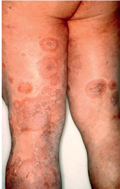
Tab. 3 Differenzialdiagnosen der Tinea faciei.

Abb. 8 59-jähriger Patient mit Trichophyton-rubrum-Syndrom: Tinea corporis generalisata mit dem Erythema multiforme ähnlicher Morphologie der erythrosquamösen Plaques.