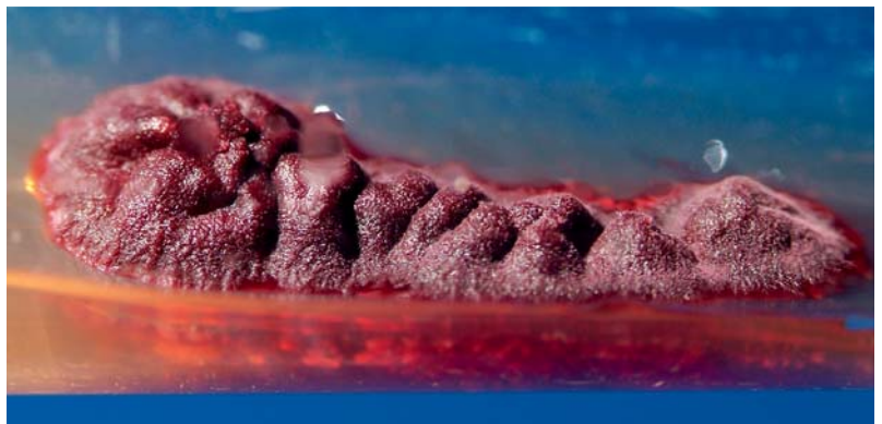
Abb. 10 Trichophyton violaceum : isoliert von einem 8-jährigen, in Leipzig lebenden afrikanischen Jungen mit Tinea capitis. Der langsam wachsende, anthropophile Dermatophyt bildet einen charakteristischen, violett-pigmentierten, glabrosen Thallus aus.

schen Ländern [30]. M. audouinii ist Erreger der klassischen Mikrosporidie, die im 18. und 19. Jahrhundert eine charakteristische Erkrankung der Kinderköpfe war und u. a. als „Waisenhauskrankung“ epidemischen Charakter hatte. In Deutschland kam es zuletzt 1962/63 im Rhein-Ruhrgebiet zu einem Ausbruch [31]. Ganz aktuell – im Jahr 2011 – kam es jedoch zu Ausbrüchen in München sowie in Wittlich (Rheinland-Pfalz) mit M. audouinii -Infektionen bei Kindern sowie Erwachsenen, die zu Immigrantenkinder aus Afrika Kontakt hatten (eigene Beobachtung).