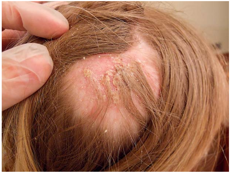
Abb. 9 Tinea capitis durch Arthroderma benhamiae bei einem 11-jährigen Mädchen. Rechts parietal entwickelte sich ein 4×5 cm großes, kreisrundes, erythematöses, zentral hyperkeratotisches, verkrustetes und schuppendes Areal mit zentrifugalem Wachstum sowie Alopezie und Juckreiz. Infektionsquelle waren wiederum Meerschweinchen.

In Deutschland werden die gleichen zoophilen Dermatophyten, wie sie für die Tinea corporis und Tinea faciei verantwortlich sind, auch bei Tinea capitis isoliert, außerdem auch T. verrucosum . M. audouinii als anthropophiler Pilz wird in Frankreich wieder vermehrt gefunden, sicher infolge der Einwanderungsbewegung aus afrikani-