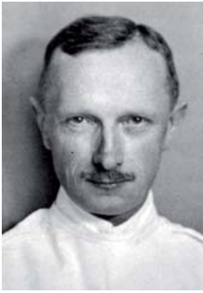
Abb. 1 Walther Löhlein (1882 – 1954), um 1925.