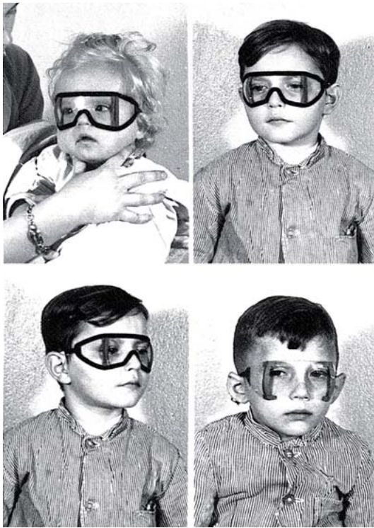
Abb. 4 Luftschutzbrille nach Dieter, Ausführung für Kinder (© Bundesarchiv Berlin, Bestand R 1501 – 3791. Mit freundlicher Genehmigung des Schattauer Verlags Stuttgart aus Rohrbach JM. Augenheilkunde im Nationalsozialismus. 1. Aufl. Stuttgart: Schattauer 2007; 164).

folger des wegen seiner jüdischen Wurzeln aus dem Amt gedrängten Alfred Bierschowsky (1871 – 1940) auf dem Lehrstuhl für Augenheilkunde in Breslau. Hier, wie auch in Kiel, war er Kreisamtsleiter des Nationalsozialistischen Deutschen Ärztebunds (NSDÄB). Sehr wahrscheinlich aufgrund seiner engen NSDAP-Bindung war Dieter Berater der Partei bei der Besetzung ophthalmologischer Lehrstühle. Ein entsprechendes Engagement lässt sich zumindest für Tübingen, wo es 1939 um die Nachfolge Wolfgang Stocks (1874 – 1956) ging, nachweisen [2]. In Breslau entwickelte Dieter einen Handmagneten („Dieter’scher Feldmagnet“) für die Extraktion intraokularer Splitter hinter der Front. Insgesamt blieb die Breslauer Klinik unter seiner Führung wissenschaftlich aber weitgehend unproduktiv [9].