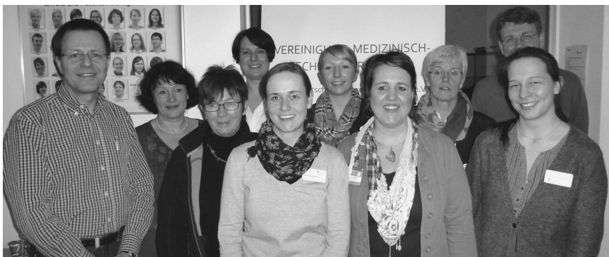
Abb. 1 Veranstaltungsteam: Erster MTRA-Interventions-Workshop gelungen: Die Aktiven freuen sich über die gute Resonanz

agnostischen Angiografie, von PTA bis Stent und von Lyse bis Stentgraft-Behandlung: Alle wesentlichen Aspekte dieser Interventionen wurden in Vorträgen und Hands-On-Workshops intensiv besprochen. Insbesondere wurde auch die inzwischen sehr anspruchsvolle Materialkunde vertieft, ergänzt durch praktische Übungen am Gefäßmodell, um die Abläufe bei verschiedenen Gefäßinterventionen zu erlernen. Das Interesse war groß, die Veranstaltung war schon früh ausgebucht. Neben Teilnehmern aus ganz Deutschland waren auch 3 MTRA aus der Schweiz angereist. Ein tolles, engagiertes Veranstaltungsteam mit Aktiven aus mehreren Kliniken und ein gelungener Wechsel zwischen Theorie und Praxis haben wesentlich zum Erfolg der Veranstaltung beigetragen.