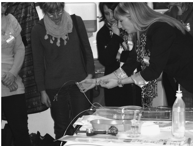
Abb. 2 Hands-On: Materialkunde am Gefäßmodell: Gewusst wie!