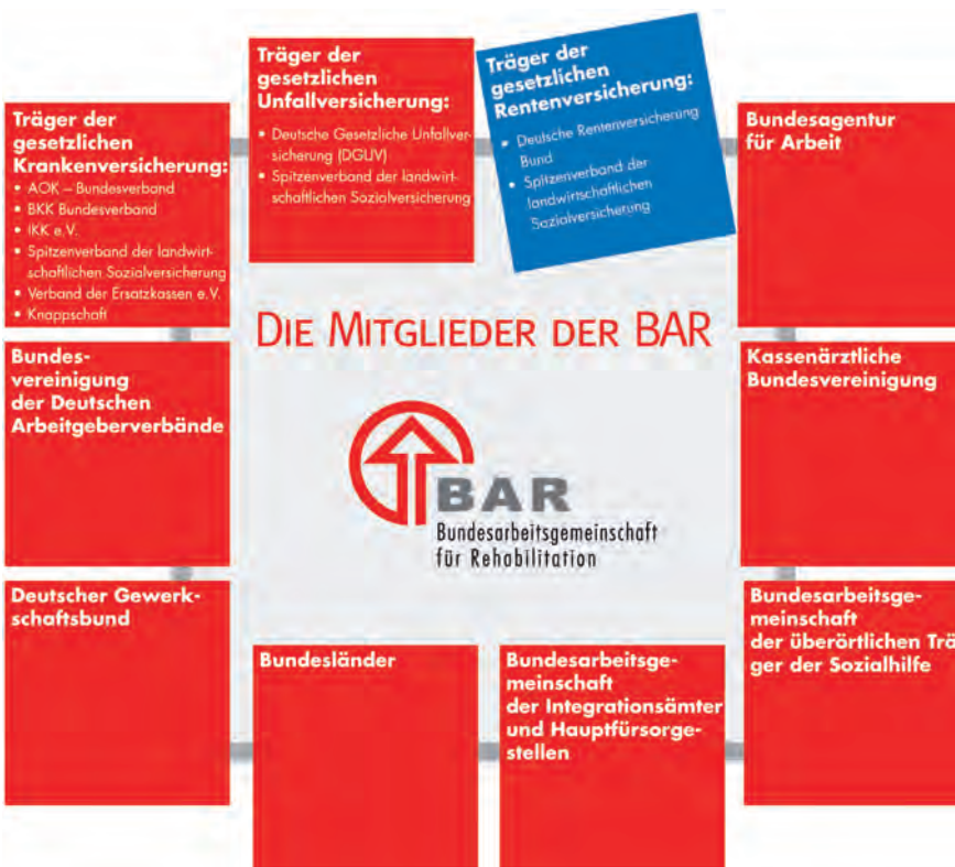
Abb. 7 BAR-Mitglieder.

Aus diesem Grund bietet die BAR auch in diesem Jahr wieder ein Seminar zum Thema an. Die eintägige Veranstaltung findet am Dienstag, den 12.6.2012 – fast ein Jahr nach Beschluss des Nationalen Aktionsplans der Bundesregierung zur Umsetzung der UN-BRK – wieder in der BAR-Geschäftsstelle in Frankfurt statt. Dieses Mal geht es speziell um die Barrierefreiheit in Kommunikation und Öffentlichkeitsarbeit, also im Kontakt mit den „Kunden“ der Rehabilitationsträger. Das Seminar richtet sich insbesondere an Mitarbeiter aus den Bereichen Öffentlichkeitsarbeit, Presse, interne/externe Kommunikation u.Ä. sowie auch an Abteilungsleiter, Referenten u.a. leitende Mitarbeiter aus den Bereichen der Rehabilitationsträger. Nach einleitenden Vorträgen am Vormittag, in denen es u.a. um Anforderungen an die Barrierefreiheit für ganz unterschiedliche Behinderungsarten gehen soll, erhalten die Seminarteilnehmenden wieder Gelegenheit, sich in Kleingruppendiskussionen konkret für ihren Arbeitsbereich über bisherige Maßnahmen, positive Erfahrungen und die Überwindung von Hindernissen bei der Herstellung von Barrierefreiheit als zentralem Baustein für gelebte Inklusion auszutauschen. ●