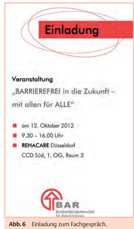
Abb.6 Einladung zum Fachgespräch.

Als Basis für die Podiumsdiskussion hat die Arbeitsgruppe die „10 Gebote der Barrierefreiheit“ erarbeitet, zu denen Sie