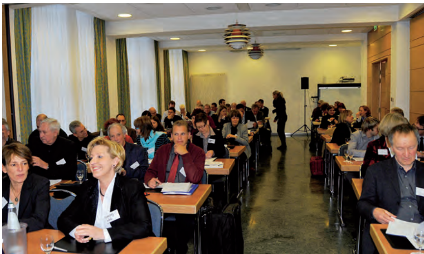
Abb.5 Blick ins Plenum.