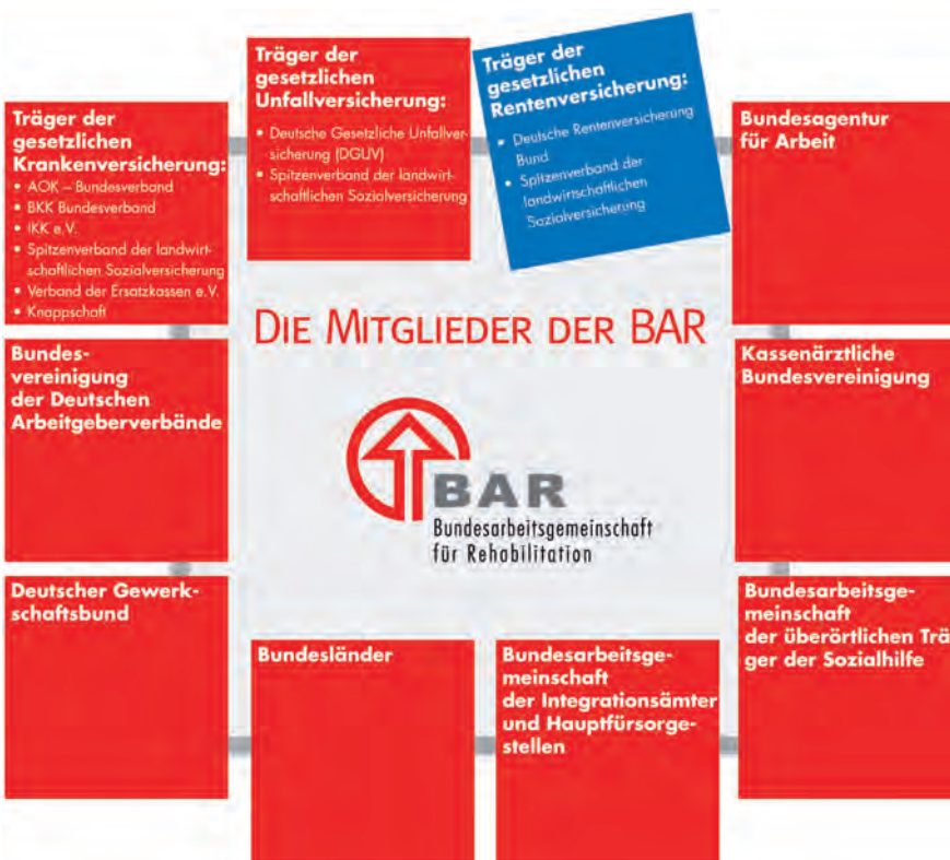
Abb. 7 BAR-Mitglieder.

Aus diesem Grund bietet die BAR auch in diesem Jahr wieder ein Seminar zum Thema an. Die eintägige Veranstaltung findet am Dienstag, den 12.6.2012 – fast ein Jahr nach Beschluss des Nationalen Aktionsplans der Bundesregierung zur Umsetzung der UN-BRK – wieder in der BAR-Geschäftsstelle in Frankfurt statt. Dieses Mal geht es speziell um die Barrierefreiheit in Kommunikation und Öffentlichkeitsarbeit, also im Kontakt mit den „Kunden“ der Rehabilitationsträger. Das Seminar richtet sich insbesondere an Mitarbeiter aus den Bereichen Öffentlichkeitsarbeit, Presse, interne/externe Kommunikation u.Ä. sowie auch an Abteilungsleiter, Referenten u.a. leitende Mitarbeiter aus den Bereichen der Rehabilitationsträger. Nach einleitenden Vorträgen am Vormittag, in denen es u.a. um Anforderungen an die Barrierefreiheit für ganz unterschiedliche Behinderungsarten gehen soll, erhalten die Seminarteilnehmenden wieder Gelegenheit, sich in Kleingruppendiskussionen konkret für ihren Arbeitsbereich über bisherige Maßnahmen, positive Erfahrungen und die Überwindung von Hindernissen bei der Herstellung von Barrierefreiheit als zentralem Baustein für gelebte Inklusion auszutauschen. ●