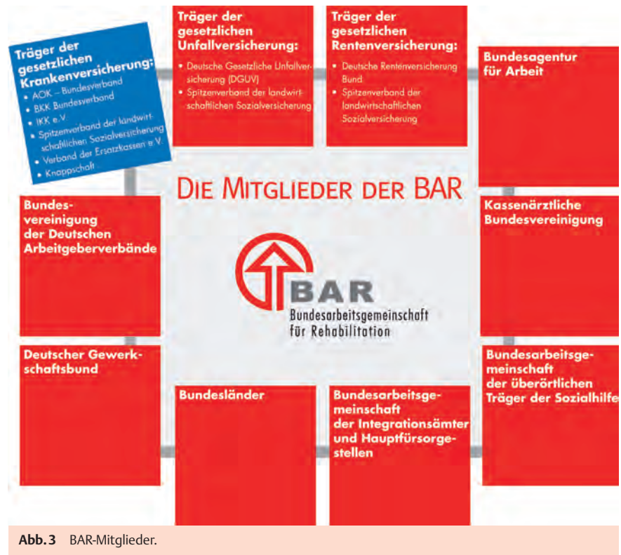
Abb. 3 BAR-Mitglieder.

In der letzten Ausgabe der Reha-Info hat sich die gesetzliche Krankenversicherung zunächst als „Gruppe“ vorgestellt. In diesem Heft präsentieren sich die einzelnen Kassenverbände mit ihren jeweiligen Besonderheiten (▶ Abb. 3 ).