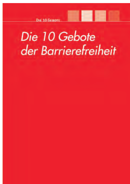
Abb. 1 10 Gebote der Barrierefreiheit.

Nach der UN-Behindertenrechtskonvention (UN-BRK) sollen Menschen mit Behinderung einen gleichberechtigten Zugang zur physischen Umwelt, zu Transportmitteln, Information und Kommunikation einschließlich der erforderlichen Technologien und Systeme haben. Die angestrebte inklusive Gesellschaft setzt voraus, dass diese Forderung umgesetzt ist.