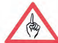
Abb. 2 10 Gebote der Barrierefreiheit in leichter Sprache.

Rehabilitation, Früherkennung und Bewältigung von Krankheiten und Behinderungen zum Ziel gesetzt haben, gefördert werden. Sie ist bereits vor 8 Jahren in Kraft getreten. Daher war eine Überarbeitung notwendig.