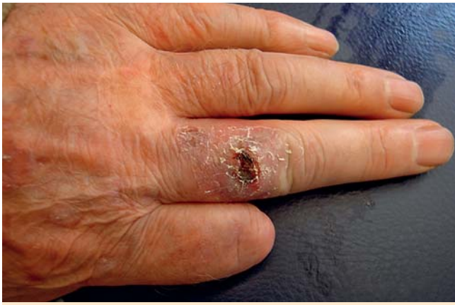
Abb. 1 Befund Tag 0: ulzerierter Tumor.