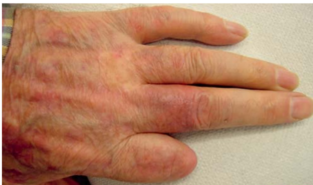
Abb. 6 Befund Tag 60: nur noch leichtes Resterythem.