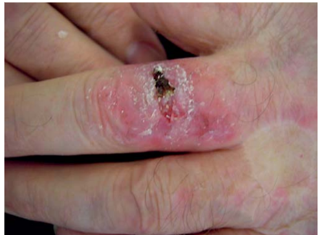
Abb. 4 Befund Tag 20: nach Abtragen des Detritus.