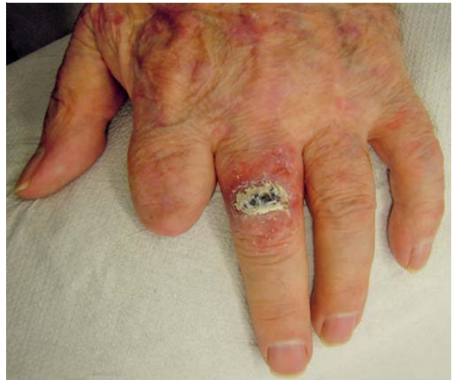
Abb. 3 Befund Tag 20: typische Lackreste nach Actikerall®.

Die Häufigkeit der aktinischen Keratose (AK) und des hellen Hautkrebses in der weißen Bevölkerung steigt weltweit dramatisch. 82% der nicht-melanozytären Tumore gehen von AKs aus [7,10]. Genaue Zahlen für Deutschland liegen nicht vor, da nicht-melanozytäre Tumoren von den meisten Krebsdatenbanken noch nicht vollständig erfasst werden. Die Kommission Hautkrebs-Screening Deutschland geht von über 100 000 Neuerkrankungen bei einer Inzidenz von 140/100 000 für Männer und 100/100 000 für Frauen aus [11]. Im Krebsregister Schleswig-Holstein stellten 2004 nicht-melanozytäre Hauttumoren bei Männern mit 22,63% und bei Frauen mit 23,75% die häufigste Krebsart dar [11]. Die AKs als Carcinoma in situ sind bei hoher Dunkelziffer noch wesentlich häufiger. Bei bis zu 20% der Betroffenen kommt es zu einem schleichenden Übergang in Plattenepithelkarzinome (SCC), bei Immunsupprimierten sogar in bis zu 60% [3]. In seltenen Fällen kann es beim SCC zum Auftreten von lymphogenen