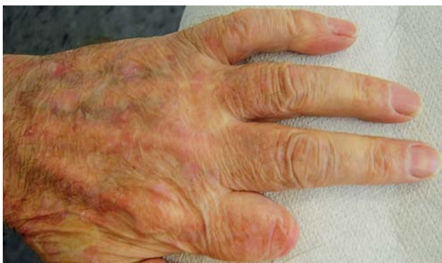
Abb. 7 Befund Tag 294: Resitutio ad integrum – Langzeitergebnis.