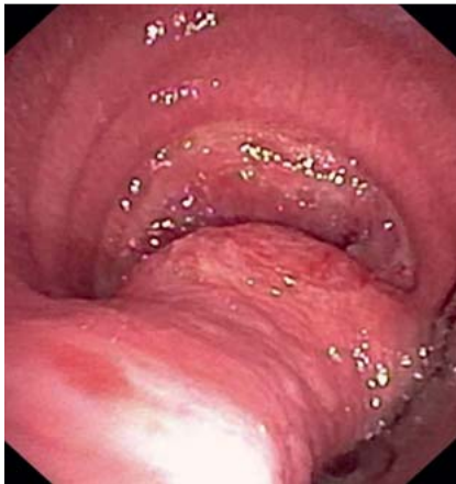
Abb. 1 Bronchoskopische Diagnostik wegen „Trachealstenose“ 8 Wochen nach konservativ behandelte Tracheahinterwandverletzung. Aufnahme während des Hustens. Normalkalibrige Trachea unter CPAP-Beatmung. Subtotaler Kollaps beim Husten.

et al. [8] zahlreiche mit der konservativen Behandlung assoziierte Probleme wie z. B. Notwendigkeit der nicht invasiven Beatmung, mehrtätige einseitige Ventilation, Notwendigkeit zur operativen Ausräumung mediastinaler Serome, Auftreten einer tracheoösophagealen Fistel, verzögerte Heilung > 4 Wochen etc. Aus der eigenen Ambulanz ist ein Fall bekannt, der 8 Wochen nach Tracheahinterwand-Verletzung einen expiratorischen Totalkollaps der Trachea beim Husten durch Protrusion mediastinalen Gewebes entwickelte (Abb. 1). Weiterhin scheint bei adipösen Patienten initial die Mediastinalprotrusion erheblich zur Luftnot und respiratorischen Erschöpfung beizutragen (Abb. 2). Hier spiegelt sich die Tatsache wider, dass die konservative Behandlung zwar zu einer stabilen Verklebung beider Wundränder mit dem dahinterliegenden mediastinalen Gewebe führt, nicht jedoch zu einer Adaptation der Wundränder miteinander. Über mittel- und langfristige funktionelle Aspekte der verschiedenen Therapien existieren bisher keine Untersuchungen.