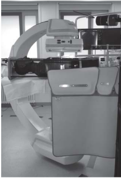
Abb. 1 Messaufbau mit Alderson-Phantom im PA-Strahlengang. Das tischmontierte Strahlenschutzsystem aus Untertisch-Vorhang und Übertisch-Aufsatz (BGW jeweils 0,5 mm) sind im Einsatz. Rechts oben am Bildrand (Pfeil) die Ionisationskammer in Augenposition des Untersuchers bei femoralem Zugang.

BGW je 0,1 mm). Aus den DFP-normierten Dosiswerten der Messungen ohne und mit Strahlenschutzbrille wurde die Schutzwirkung bestimmt. Der Sensor der Belichtungskontrolle wurde so positioniert, dass die Messungen jeweils mit vergleichbaren Aufnahmeparametern erfolgten. Die TLDs wurden am Tag der Bestrahlung mit einem System der Firma Fimel ausgewertet (LTM-Reader, Fa. Fimel, Fontenay aux Roses, Fr). Das für einzelne TLD-Elemente normalerweise etwas unterschiedliche Dosis-Ansprechverhalten wurde durch Korrekturfaktoren berücksichtigt, welche sich aus den Ergebnissen einer homogenen Bestrahlung der TLDs in einem Irradiator ergaben.