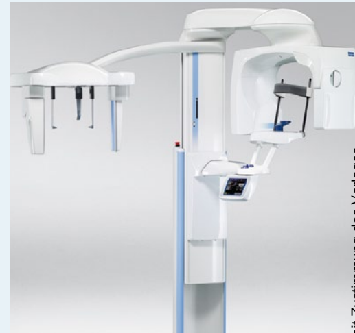
Nach einer Pressemitteilung der Planmeca Oy, FIN – Helsinki

Alle ProMax Geräte, die Module und Upgrade-Möglichkeiten sind auf www.planmeca.de übersichtlich dargestellt.