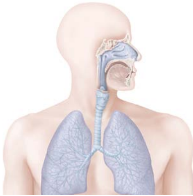
Coronaviren rufen verschiedene und unterschiedlich stark ausgeprägte Erkrankungen der Atemwege hervor.