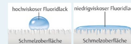
Hochviskoser Lack steht auf der Oberfläche. Niedrigviskoser Lack Fluor Protector S dringt in die Oberfläche ein.