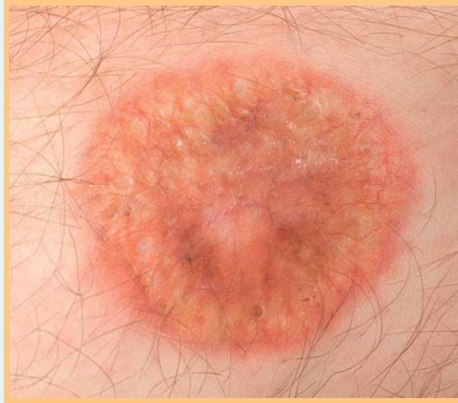
Abb. 2 Polyzyklische, scharf begrenzte, derbe Plaques, die ein atrophes gelbliches Zentrum mit Teleangiektasien aufweisen. Die Ränder sind livide, bräunlich-rot.