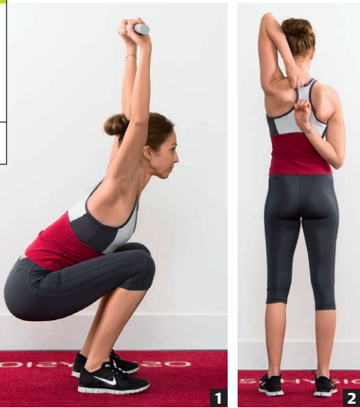
Abb. 1 Die Deep-Squat-Übung Abb. 2 Die Shoulder-Mobility-Übung

Zum Artikel „Testbatterie für Aktive“, physiopraxis 4/13