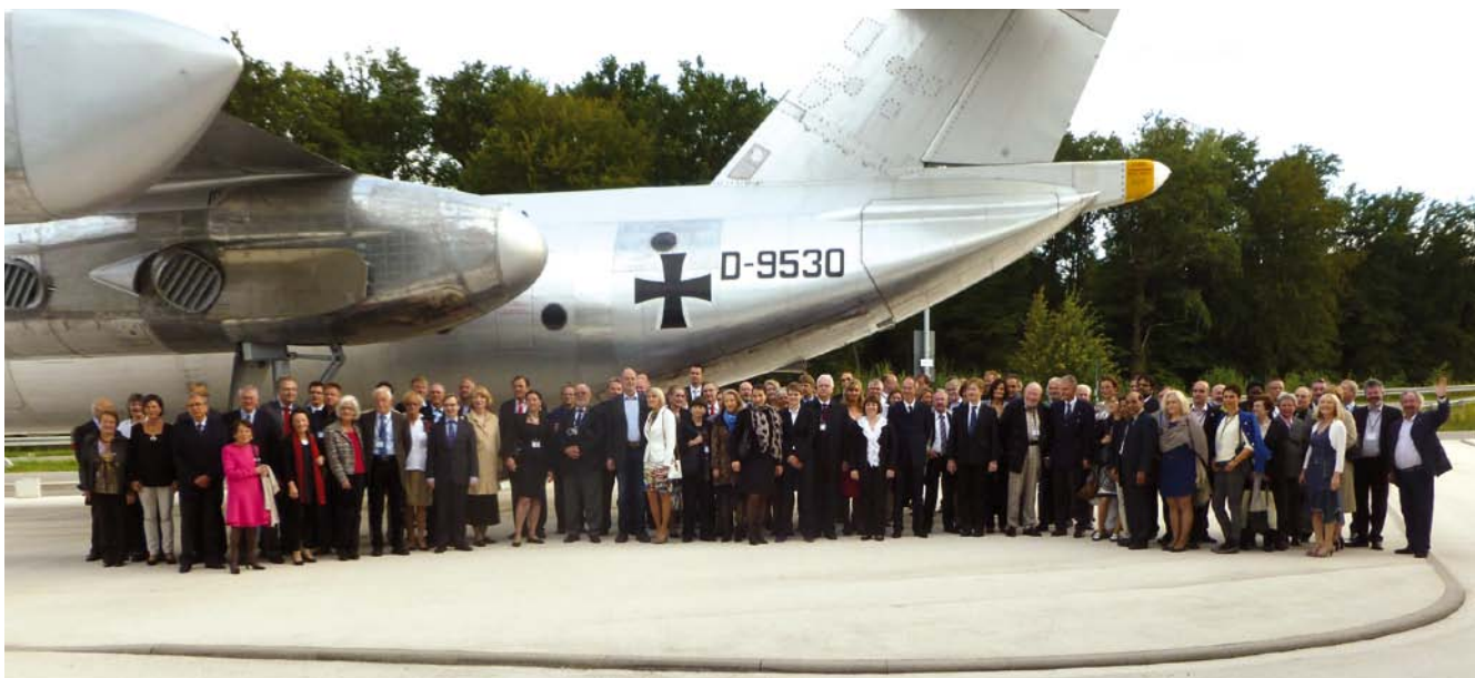
Teilnehmer der Drei-Länder-Tagung für Luft- und Raumfahrtmedizin vor dem Dorniermuseum.