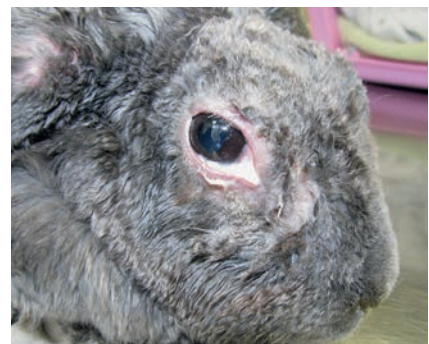
Abb. 4 Dakryozystitiden treten häufig in Verbindung mit Kaninchenschnupfen auf.

Eine aus der Tiefe der Nasenhöhle entnommene Tupferprobe liefert in der Regel zuverlässigere Ergebnisse. Hierzu