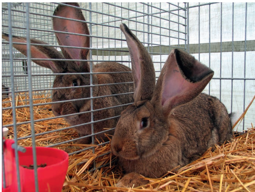
Abb. 1 Auf Ausstellungen besteht ein besonders hohes Infektionsrisiko für Kaninchenschnupfen.

Klassisch ist eine reine Rhinitissymptomatik , die von gelegentlichem Niesen mit serösem Auswurf (► Abb. 2 ) über leicht eitrigem Nasenausfluss mit nasalen Stridorgeräuschen (► Abb. 3 ) bis zu Maulatmung aufgrund von mukopurulent verklebten Nasenöffnungen reichen kann.