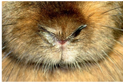
Abb. 3 Kaninchen mit mäßigem eitrigem Nasenausfluss.

Eine Verminderung der Futteraufnahme bis zur Inappetenz kann aufgrund der Einschränkungen des Geruchs- und Geschmackssinns auftreten. Weichen Kaninchen aufgrund verlegter Nasenöffnungen auf Maulatmung aus, stellen sie ebenfalls die Futteraufnahme ein, da der Kauvorgang die Atmung weiter behindern würde.