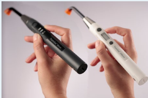
Translux Wave (li) und Translux 2Wave

Heraeus Kulzer bietet Zahnärzten ab sofort 2 neue LED-Lichtpolymerisationsgeräte für lichthärtende orale Adhäsive und Füllungsmaterialien. Translux Wave und Translux 2Wave zeichnen sich durch einen optimierten Lichtleiter und hohen Bedienkomfort aus. Damit ergänzt das Unternehmen seine Polymerisationsgeräte um