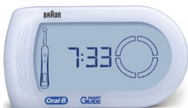
Abb. 7 ... mit SmartGuide

Dieser Beitrag entstand mit freundlicher Unterstützung der Procter & Gamble Germany GmbH, Schwalbach am Taunus