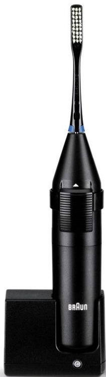
Abb. 2 Braun D1