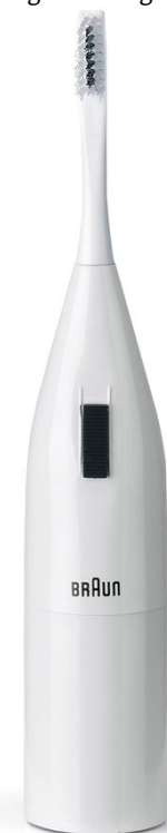
Abb. 1 Mayadent

1991 brachten die Oral-B-Ingenieure dann das oszillierend-rotierende Putzsystem zur Marktreife – ein Paradigmen-