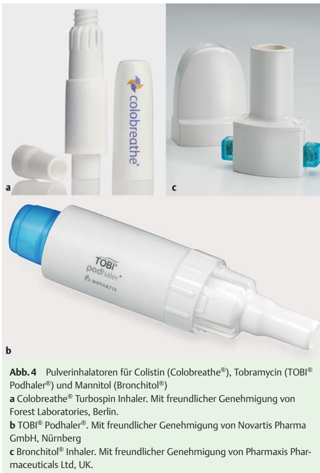
Abb. 4 Pulverinhalatoren für Colistin (Colobreathe®), Tobramycin (TOBI® Podhaler®) und Mannitol (Bronchitol®) a Colobreathe® Turbospin Inhaler. b TOBI® Podhaler®. c Bronchitol® Inhaler.

de Dosen von 40 mg, 80 mg, 120 mg und 160 mg Mannitol unter Überwachung von Spirometrie und Sauerstoffsättigung appliziert [16].