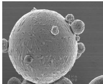
Abb. 3 Sprühgetrocknetes Mannitol.

aeruginosa . Die Einzeldosis von 112 mg, also 4 Kapseln à 28 mg, entspricht bei Mukoviszidosepatienten der 300 mg Dosis der Inhalationslösung [10]. Der pulmonal deponierte Anteil von Tobramycin war bei Gesunden mit 34,2% rund dreimal höher als bei der Inhalationslösung, und die Variabilität zwischen den Versuchspersonen betrug nur 17% [8]. Die maximalen Sputumkonzentrationen von Tobramycin lagen mit rund 1000 µg pro Gramm Sputum bis zu 100fach höher als die bei P. aeruginosa normalerweise zu beobachtenden minimalen Hemmkonzentrationen [8]. Ein kleiner Teil des Antibiotikums wird resorbiert, und nach 80 mg Tobramycin-Pulver lagen die maximalen Serumkonzentrationen bei durchschnittlich 0,60 µg/ml im Vergleich zu 0,28 µg/ml nach 300 mg Tobramycin-Inhalationslösung [8].