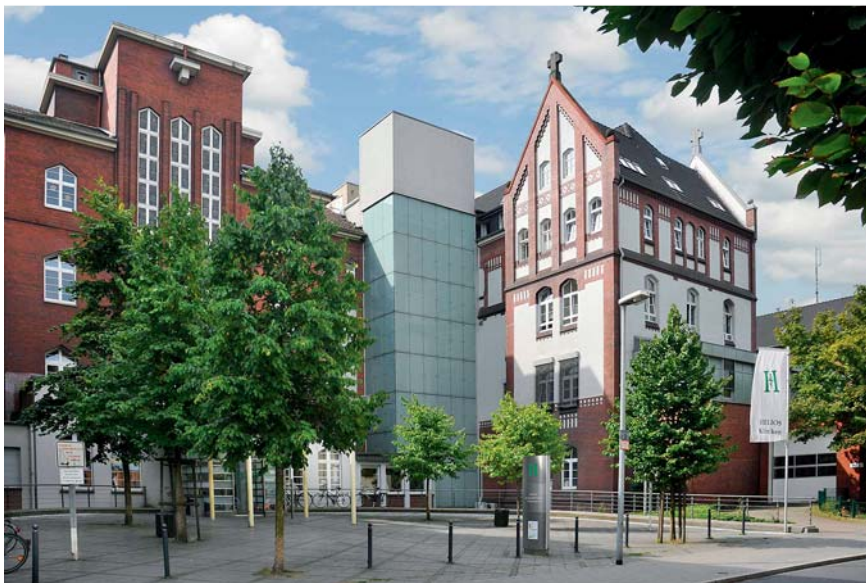
Abb. 10 Frontansicht der HELIOS St. Elisabeth Klinik Oberhausen im Jahr 2014.