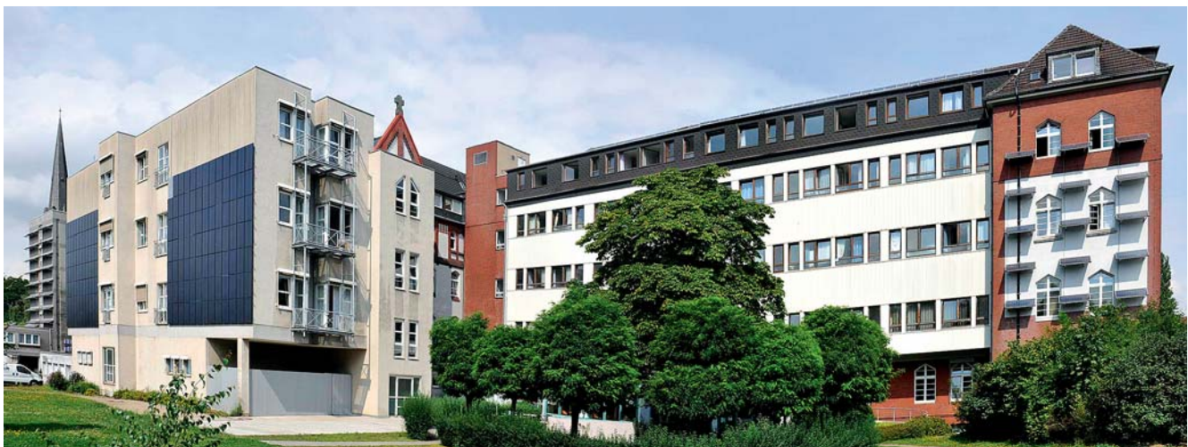
Abb. 11 Gartenansicht der HELIOS St. Elisabeth Klinik Oberhausen im Jahr 2014.