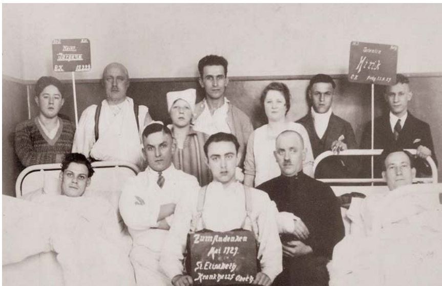
Abb. 4 Einblick in ein Patientenzimmer der St. Elisabeth Klinik im Jahr 1929.