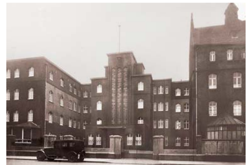
Abb. 1 Frontansicht der HELIOS St. Elisabeth Klinik Oberhausen im Jahr 1928.