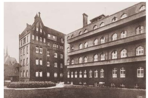
Abb. 2 Gartenansicht der HELIOS St. Elisabeth Klinik Oberhausen im Jahr 1928.

der neue Leiter vorwiegend mit der Behandlung der sich auf dem Vormarsch befindlichen Geschlechtskrankheiten und deren Komplikationen befasst. Besonders hervorzuheben sind hier die Gonorrhoe und die Folgen der mit der organischen Arsenverbindung Salvarsan behandelten Syphilispatienten. In den kommenden Jahren änderte sich das Krankengut allmählich, wobei neben den in den 1920er-Jahren häufig gewordenen Haarpilzkrankungen wie Favus und Mikrosporie zunehmend Patienten mit Psoriasis, Lupus erythematodes und Hauttuberkulose in den Vor-