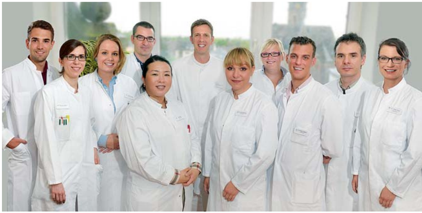
Abb. 9 Ärzteteam der Hautklinik Oberhausen im Jahr 2014.