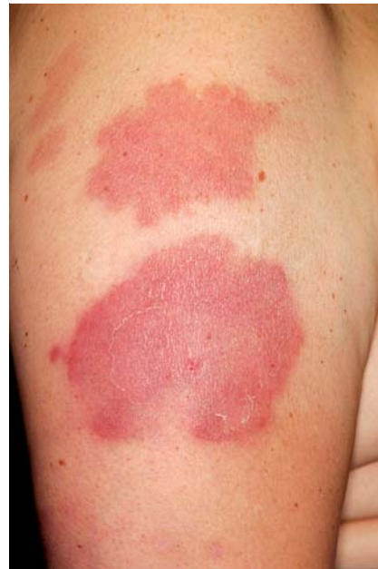
Abb. 1 Klinik des Sweet-Syndroms: schmerzhafte, sukkuente, erythematöse Plaques am rechten Oberarm.

Das Sweet-Syndrom (SS), erstmals 1964 als „akute febrile neutrophile Dermatose“ beschrieben [22], zeichnet sich durch Fieber, periphere Neutrophilie und schmerzhafte, sukkuente, papulöse oder plaqueförmige Hautveränderungen aus (● Abb. 1 ). Histologisch zeigt sich in der oberen Dermis ein diffuses, dichtes Infiltrat aus reifen neutrophilen Granulozyten (● Abb. 2 ). Die Ätiologie ist unklar, jedoch wird eine Assoziation mit Infekten und hämatologischen Tumoren nahegelegt. Hohe Level des Zytokins Granulozyten-Kolonie-stimulierender Faktor (GCSF) wurden wiederholt in Patientenserien nachgewiesen [23]. Ferner gibt es auch Fallbe-