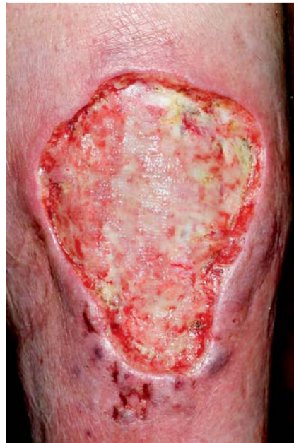
Abb. 3 Klinik des Pyoderma gangraenosum: progredientes, schmierig belegtes Ulkus am rechten Unterschenkel mit aufgeworfenem, unterminiertem, lividem Randsaum.

Acne inversa (AI), im angelsächsischen Bereich auch als Hidradenitis suppurativa bezeichnet, ist eine chronische neutrophile Entzündung der Terminalhaarfollikel, welche durch sterile Abszesse und Fistelbildungen, insbesondere der Achseln und Leistenbeugen, charakterisiert ist. Hinweise verdichten sich, dass auch bei Acne inversa Fehlfunktionen der angeborenen Immunität eine wichtige Rolle spielen könnten. Erhöhte Zytokinlevel, vor allem von TNF- \alpha und IL-1 \beta , konnten in Zellkulturen von AI-Haut nachgewiesen werden [34] und bieten eine biologische Grundlage für den Einsatz von Biologika. Therapeutisch empfehlen sich Antibiotikakombinationen, Isotretinoin oder die operative Therapie. Bei schwerer oder rezidivierender AI wurden zunehmend Biologika in die Therapie eingeführt. In größeren randomisierten,