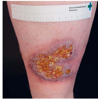
Abb. 3 Typisches klinisches Erscheinungsbild eines Pyoderma gangränosum.

gruppe unterschiedliche Krankheitsbilder wie Polyarteriitis nodosa, Systemvaskulitiden wie Morbus Wegener oder Immunkomplex-assoziierte Vaskulitiden zählen, sind kutane Ulzerationen ein häufig zu findendes Zeichen dieser Erkrankungen im Zuge des entzündungsbedingten Verschlusses von Gefäßen unterschiedlichen Kalibers. Auch das immer noch kaum verstandene Krankheitsbild des Pyoderma gangränosum war mit einer Häufigkeit von 3% relativ oft vertreten [2]. Die Diagnosestellung ergibt sich bei dieser Erkrankung vorwiegend aus dem klinischen