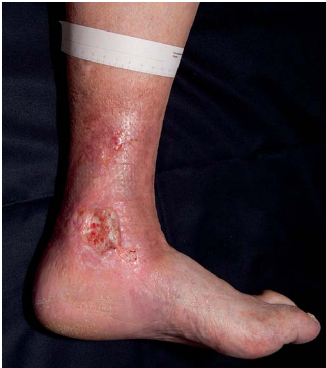
Abb. 1 Typische Lokalisation eines venösen Ulkus.