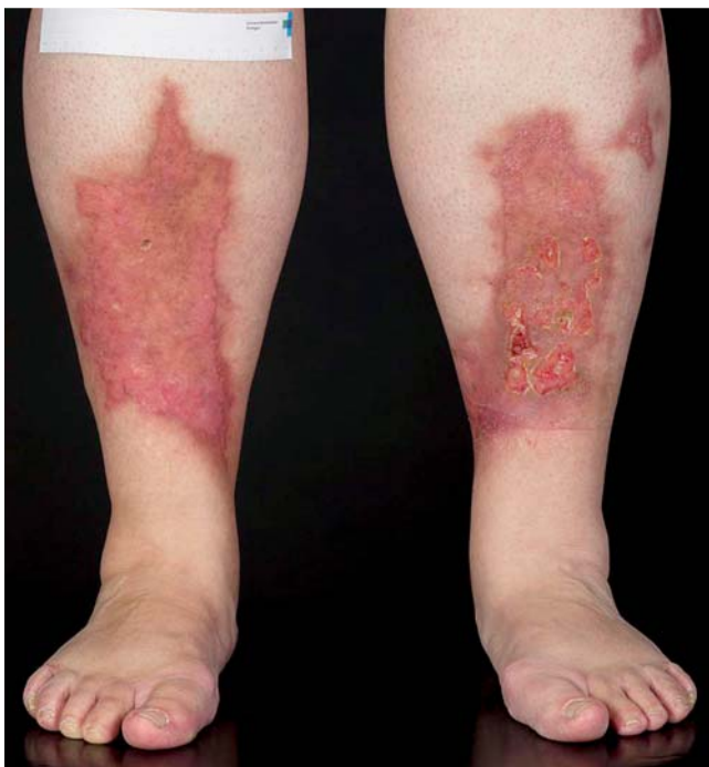
Abb. 2 Typische Lokalisation einer Necrobiosis lipoidica.

gruppe unterschiedliche Krankheitsbilder wie Polyarteriitis nodosa, Systemvaskulitiden wie Morbus Wegener oder Immunkomplex-assoziierte Vaskulitiden zählen, sind kutane Ulzerationen ein häufig zu findendes Zeichen dieser Erkrankungen im Zuge des entzündungsbedingten Verschlusses von Gefäßen unterschiedlichen Kalibers. Auch das immer noch kaum verstandene Krankheitsbild des Pyoderma gangränosum war mit einer Häufigkeit von 3% relativ oft vertreten [2]. Die Diagnosestellung ergibt sich bei dieser Erkrankung vorwiegend aus dem klinischen