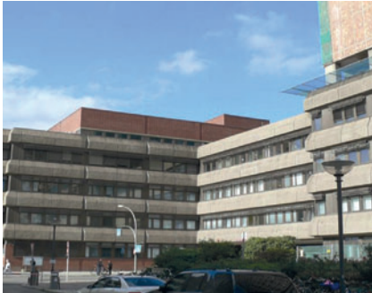
Röntgeninstitut nach 1981

Im Ergebnis entstand das neue Domizil des Röntgeninstituts im Hochhaus und dem über die Brücke erreichbaren Funktionstrakt. Einzug war im Jahre 1981.