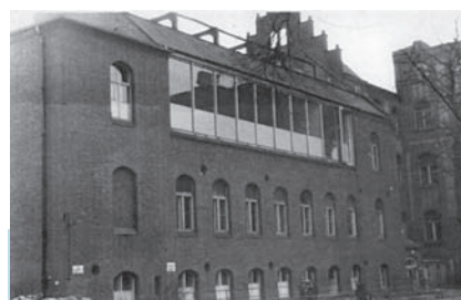
Röntgeninstitut in der Chirurgischen Klinik 1950