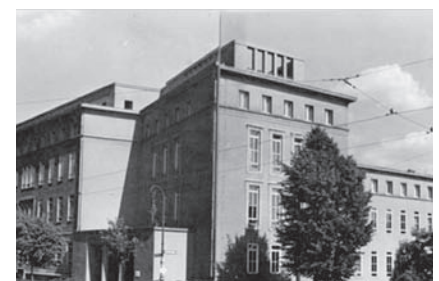
Geschwulstklinik an der Invalidenstraße