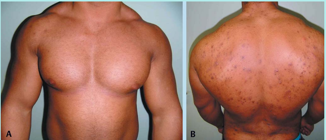
Abb. 1 Vorder- (A) und Rückansicht (B) des Patienten.