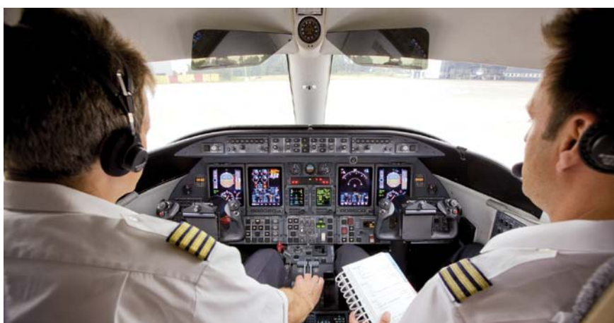
Abb. 4 Das neue Flugzeug hat auch aus Pilotensicht einige Vorteile.