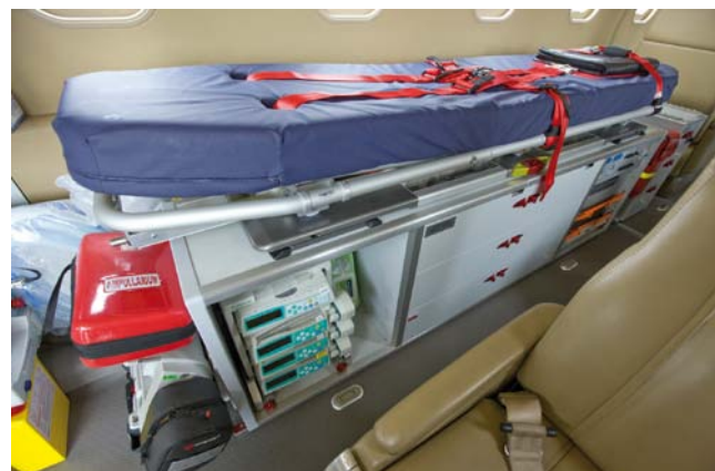
Abb. 3 Medizinische Geräte entsprechen höchstem Standard in der Intensiv- und Notfallversorgung.