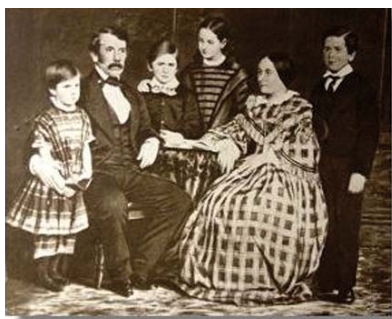
David Livingstone mit Ehefrau Mary und Kindern, die ersten Patienten, die er mit seinem Chininrezept behandelte.

Livingstone erstand von seinen ersten Entlohnungen eine lateinische Grammatik, die er auf dem Webstuhl befestigte,