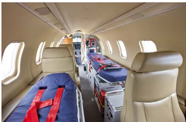
Abb. 2 Wichtigste Neuerung ist die Doppelstretcherkonfiguration, mit der 2 Patienten gleichzeitig transportiert und unabhängig voneinander behandelt werden können.