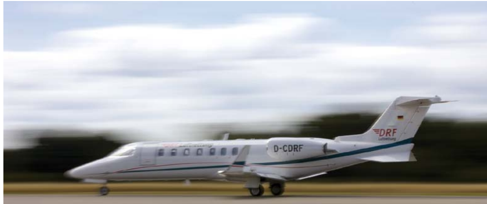
Abb. 1 Das neue Flottenmitglied der DRF Luftrettung: schnell unterwegs und optimal für weltweite Ambulanzflüge ausgestattet.

Der erste Doppelstretchereinsatz ging von Madeira über Porto nach Paris. Transportiert wurden 2 Unfallopfer: Ein Mann hatte nach einem Sturz eine Hirnblutung erlitten und war in der Neurochirurgie in einer Klinik auf Madeira operiert und versorgt worden. Die medizinische Besatzung des Ambulanzflugzeugs übernahm den Patienten in der Klinik. Aufgrund der Befunde, seines kritischen Zustands und in Hinblick auf den für den Patienten sichersten Transport entschied die medizinische Besatzung, ihn noch in der Klinik zu analgosedieren und zu intubieren. Der andere in Porto aufgenommene Patient hatte sich nach einem Quadunfall eine Beckenfraktur zugezogen, die in einer Klinik vor Ort operiert worden war. Der kompli-