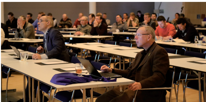
Ein breites Themenspektrum erwartete die Teilnehmer des AFOR Kurses 2014 in Pontresina.

Die Auswahl der Referenten war qualitativ hochwertig. 60 Ordinarien, Chefärzte, anderweitige Spezialisten und Wissenschaftler waren anwesend, um ihr Fachwissen an die Teilnehmer zu bringen. Da-