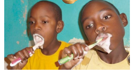
Gutes tun: Patienten können das Altgold einer karitativen Organisation wie der Stiftung Hilfswerk Deutscher Zahnärzte (HDZ) spenden.