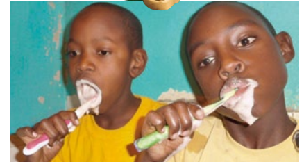
Gutes tun: Patienten können das Altgold einer karitativen Organisation wie der Stiftung Hilfswerk Deutscher Zahnärzte (HDZ) spenden.