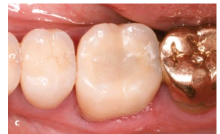
Beispiel einer Füllungstherapie. a) Zahn 46 unmittelbar nach Obturation mit Guttapercha. b) Bulkfüllung mit SDR: Selbstnivellierung und Kavitäten-Adaptation. c) Finale Situation mit Ceram X mono+ als Deckschicht (Fotos: Dr. Marcus Holzmeier, Crailsheim).