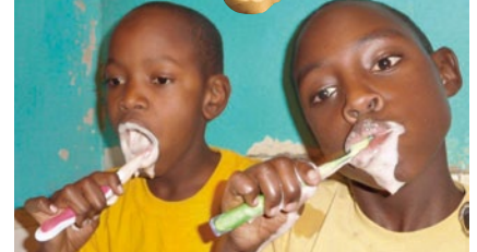
Gutes tun: Patienten können das Altgold einer karitativen Organisation wie der Stiftung Hilfswerk Deutscher Zahnärzte (HDZ) spenden.