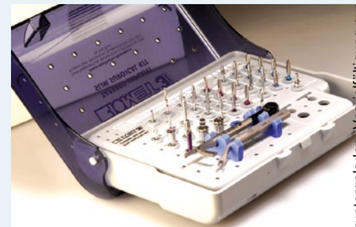
Nach einer Pressemitteilung der BIOMET 3i Deutschland GmbH, München

Durch die Reduktion auf die wesentlichen Bauteile wird es besonders Einsteigern ermöglicht, die häufig doch komplexen Arbeitsschritte in der zahnärztlichen Implantologie sicher zu meistern. Mit der klaren Kodierung entsprechend der benötigten Bohrerprotokolle und den passenden Instrumenten in Griffnähe unterstützt das Kit den Zahnarzt bei einem sicheren und effizienten Workflow. Neukunden macht BIOMET3i ein besonderes Angebot: sie erhalten beim Kauf von 10 T3-Implantaten ein Slim Chirurgie-Kit (SLIMKT) und ein prothetisches Starter-Kit gratis dazu.