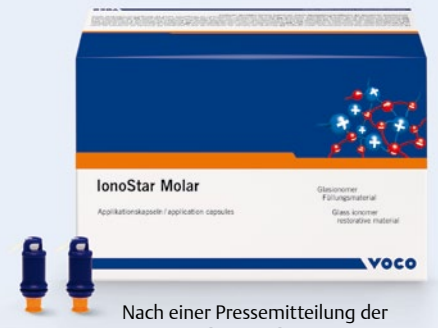
Nach einer Pressemitteilung der VOCO GmbH, Cuxhaven Internet: www.voco.de

sche wie haltbare Restaurationen schnell und einfach herstellen. IonoStar Molar eignet sich für Füllungen von nicht okklusionstragenden Kavitäten der Klasse I, semipermanente Füllungen von Kavitäten der Klasse I und II, Füllungen von Zahnhalsläsionen, Klasse-V-Kavitäten, Behandlung von Wurzelkaries, Füllungen von Klasse-III-Kavitäten, Restauration von Milchzähnen, als Unterfüllung bzw. Liner, für den Stumpfaufbau sowie für temporäre Füllungen.