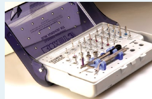
Nach einer Pressemitteilung der BIOMET 3i Deutschland GmbH, München

Durch die Reduktion auf die wesentlichen Bauteile wird es besonders Einsteigern ermöglicht, die häufig doch komplexen Arbeitsschritte in der zahnärztlichen Implantologie sicher zu meistern. Mit der klaren Kodierung entsprechend der benötigten Bohrerprotokolle und den passenden Instrumenten in Griffnähe unterstützt das Kit den Zahnarzt bei einem sicheren und effizienten Workflow. Neukunden macht BIOMET3i ein besonderes Angebot: sie erhalten beim Kauf von 10 T3-Implantaten ein Slim Chirurgie-Kit (SLIMKT) und ein prothetisches Starter-Kit gratis dazu.